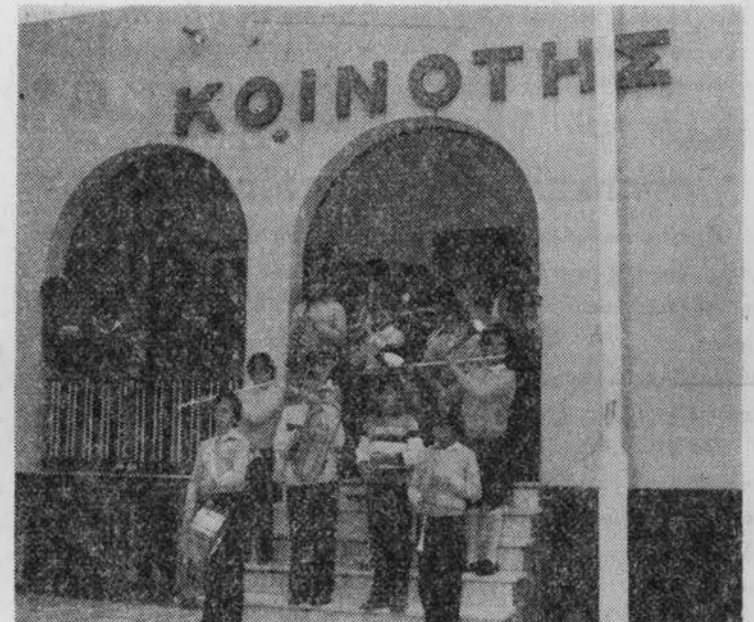
Η Φιλαρμονική της Ραφήνας κατά την πρώτη Προτοχορική εμφάνισή της