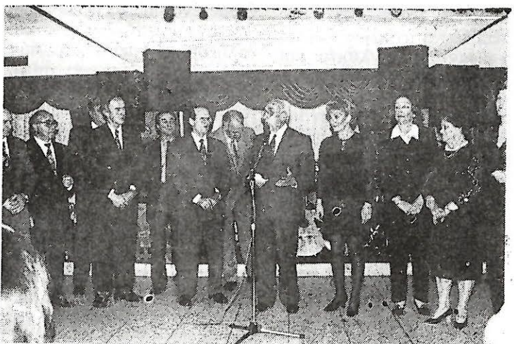
Ένα μέλη του Διοικ. Συμβουλίου του Συλλόγου μας με τα μέλη της Διοικ. Επιτροπής του Παραρτήματός μας στην Ν. Τρίγλια

τρόπο κινητοποίησης, διάθεσης προσκλήσεων και συγκέντρωσης δώρων.