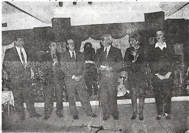
Ένα μέλη του νέου Διοικητικού Συμβουλίου του Συλλόγου μας