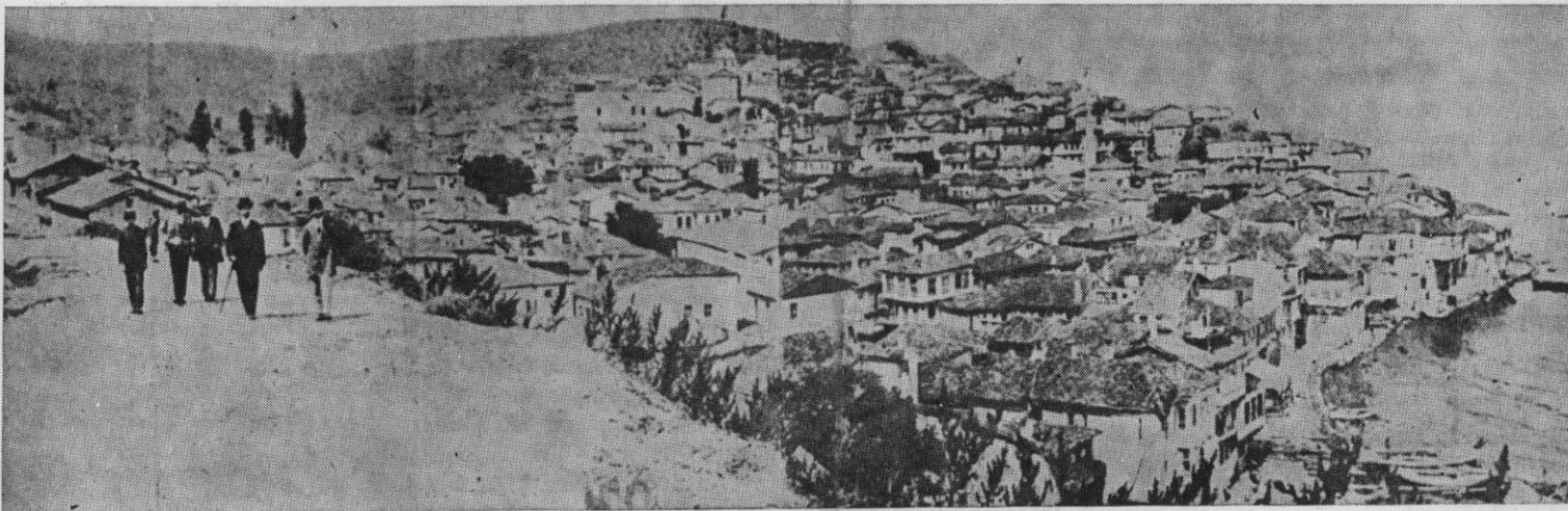
ΓΕΝΙΚΗ ΑΠΟΨΗ ΤΗΣ ΠΕΡΙΦΗΜΟΥ ΠΟΛΕΩΣ ΤΗΣ ΒΙΘΥΝΙΑΣ ΤΡΙΓΛΙΑΣ

Ἐμβάσματα - Δημοσιεύσεις εἰς κ. ΓΑΒΡ. ΜΗΤΣΟΥ Κομνηνῶν 21 - Θεσ/νίκη