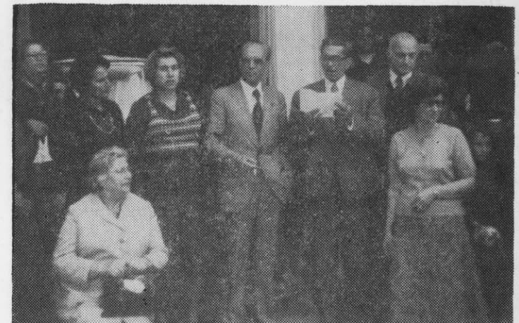
Ο Πρόεδρος του παραρτήματος Ραφήνας όμιλεί στους συγκεντρωθέντες Τριγλιανους στα Χάνια Πηλίου.

Τρίγλιας με ραντεβού στα Χάνια του Πηλίου τό μεσημέρι της Κυριακής για φαγητό. Σε όλη την διάρκεια της εκδρομής στα ποδύμαν έπεκράτησε ατμόσφαιρα χαράς και ένθουσιασμού. Μετά την στάθμευση στην όραία Μακρυνίτσα όπου μείναμε μισή ώρα, φθάσαμε τό μεσημέρι στα Χάνια του Πη-