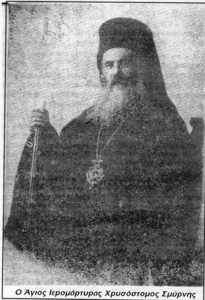
Ο Άγιος Ιερομάρτυρας Χρυσόστομος Σμύρνης

παντού απλώνεται η σκιά του θανάτου, χιλιάδες έλληνες βασανίζονται, δολοφονούνται γιατί κάποιους τους πρόδωσαν, κάποιους τους εγκατέλειψαν ως και ο ύπατος αρμοστής καταφέρνει να το σκάσει και να σώσει το τομάρι του. Ο Ιεράρχης όμως όχι-