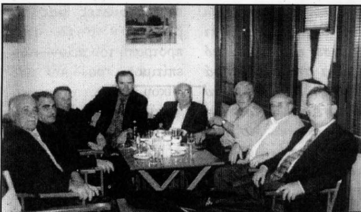
Ο Δήμαρχος της Παλαιάς Τρίγλιας & ο πρώην πρόεδρος του Συλλόγου μας με τους Τούρκους προσκεκλημένους & με τους συμπατριώτες μας Τριγλιανούς.

Με όλα αυτά και με την βοήθεια των δύο χορωδιών δημιουργήθηκε μια ιδιαίτερα ζεστή και όμορφη ατμόσφαιρα. Μετά το τέλος της