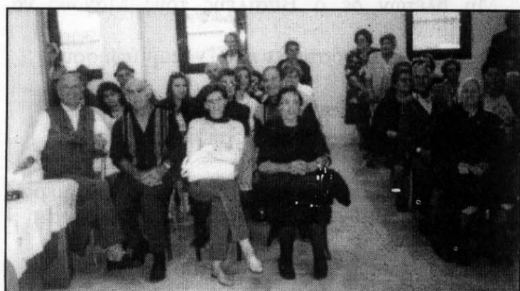
Από την εκδρομή του Παραρτήματος Νέες Τρίγλιες στο Νυμφαίο - Πτολεμαίδα.

Επιθυμούμε να κάνουμε γνωστό και μέσω της εφημερίδας μας σε όσες κυρίες πιθανόν να μη το γνωρίζουν και θέλουν να συμμετέχουν ότι ο Σύλλογός θα είναι ανοικτός για όλες κάθε Τρίτη απόγευμα στις 5:00 μ.μ.