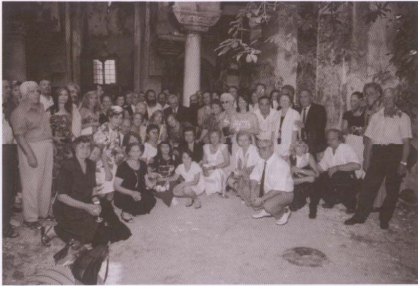
Στο εσωτερικό της Παντοβασιλίσσας