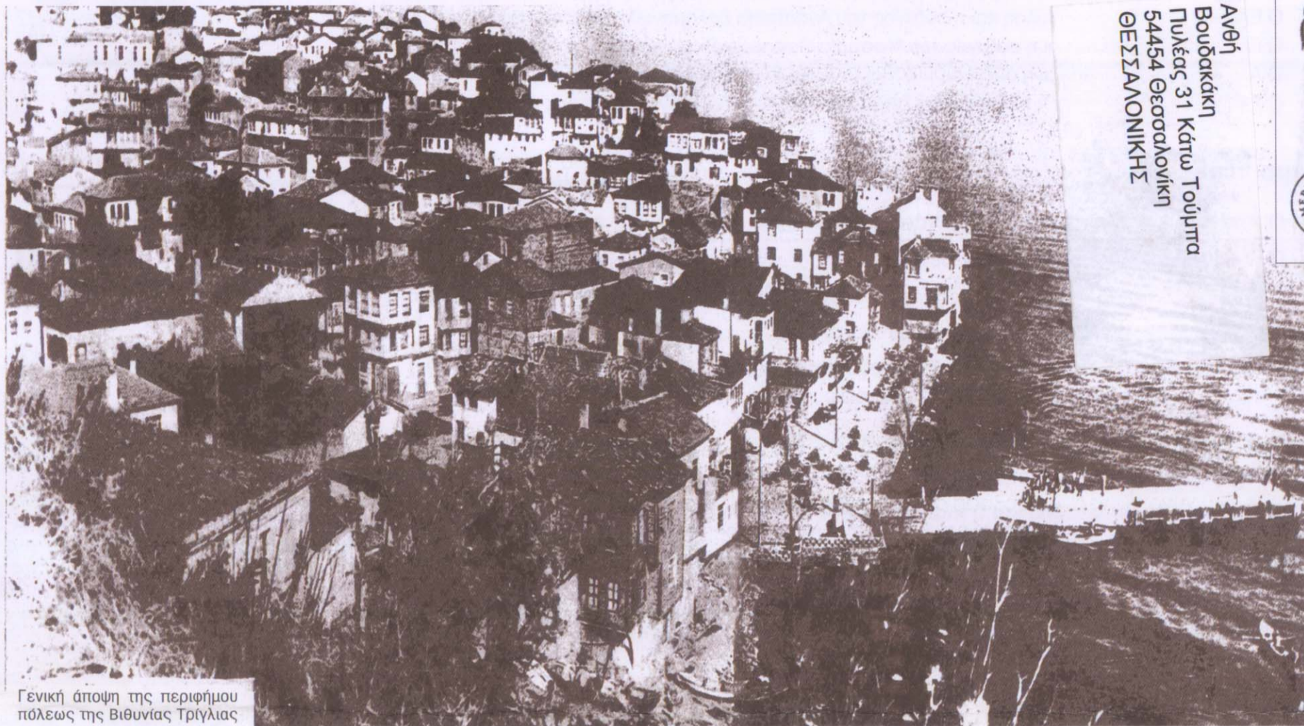
Γενική άποψη της περιφέρειας της πόλεως της Βιθυνίας Τρίγλιας

ΕΦΗΜΕΡΙΔΑ ΤΟΥ ΣΥΛΛΟΓΟΥ ΤΩΝ ΑΠΑΝΤΑΧΟΥ ΤΡΙΓΛΙΑΝΩΝ