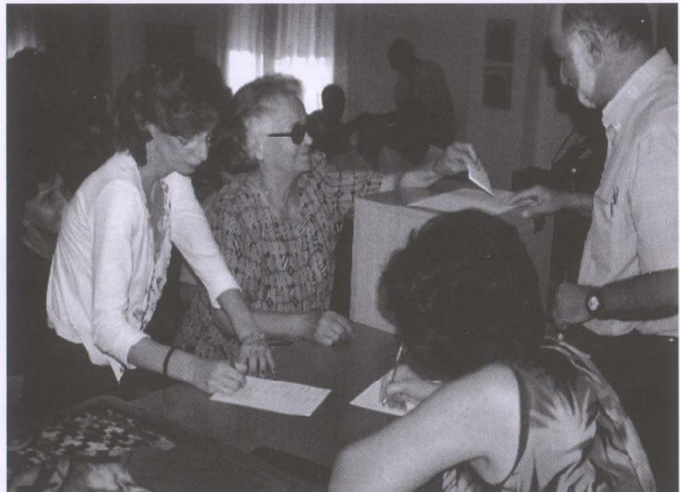
Φωτογραφία από τις εκλογές του συλλόγου