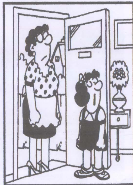
Μαμά είναι η γειτόνισσα μας αυτή που λες ότι είναι αντιπαθητική!