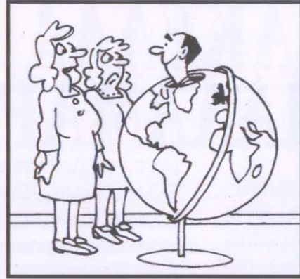
Ο άνδρας μου ζει στον κόσμο του

● - Κοίτα εμένα, κι'εγώ έχω εξέτασεις αλλά όπως βλέπεις είμαι ψύχραιμος. - Ναι, αλλά εσείς είστε καθηγητής!