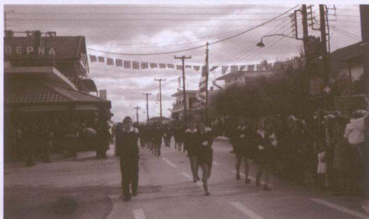
Φωτογραφία από την μαθητική παρέλαση στη Ν. Τρίγλια

Στις 27 Οκτωβρίου του 2003, στο χώρο των πολιτιστικών εκδηλώσεων του Γυμνασίου Ν. Τρίγλιας πραγματοποιήθηκε εκδήλωση εορτασμού για τη Σημαία και το έπος της 28ης Οκτωβρίου 1940. Μαθητές του σχολείου παρουσίασαν με επιτυχία το χρονικό του αγώνα των Ελλήνων εναντίον των Ιταλών και Γερμανών κατακτητών. Απήγγειλαν ποιήματα και τραγούδησαν ανάλογα με την εορτή τραγούδια. Στις 28 Οκτωβρίου έγινε στο κεντρικό δρόμο της Νέας Τρίγλιας η καθιερωμένη μαθητική παρέλαση, που την παρακολούθησε πλήθος κόσμου.