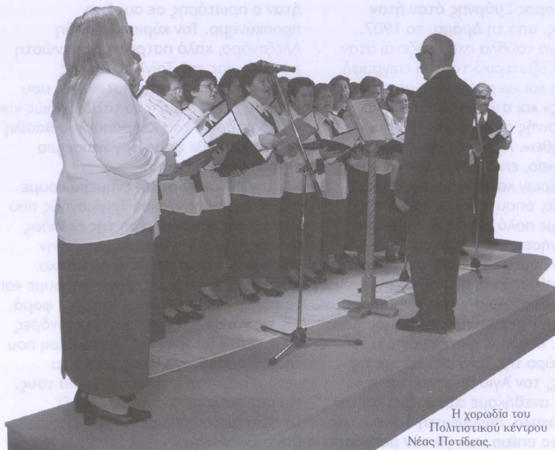
Η χορωδία του Πολιτιστικού κέντρου Νέας Ποτίδαιας.

Μετά το τέλος της εκδήλωσης, δόθηκε δεξίωση στο σαλόνι του Πολιτιστικού μας Κέντρου.