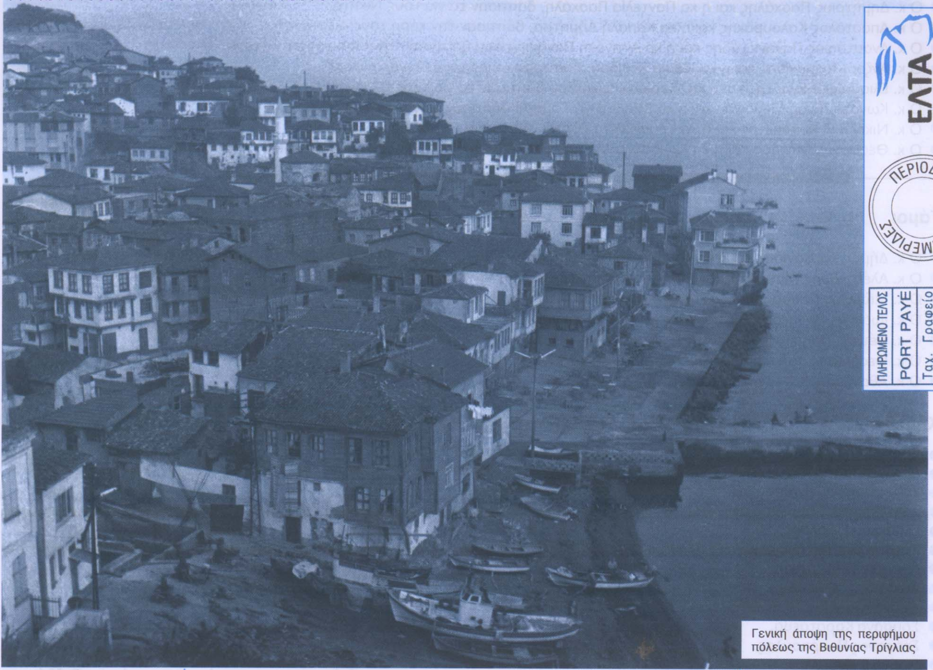
Γενική άποψη της περιφέρειας πόλεως της Βιθυνίας Τρίγλιας

ΕΦΗΜΕΡΙΔΑ ΤΟΥ ΣΥΛΛΟΓΟΥ ΤΩΝ ΑΠΑΝΤΑΧΟΥ ΤΡΙΓΛΙΑΝΩΝ