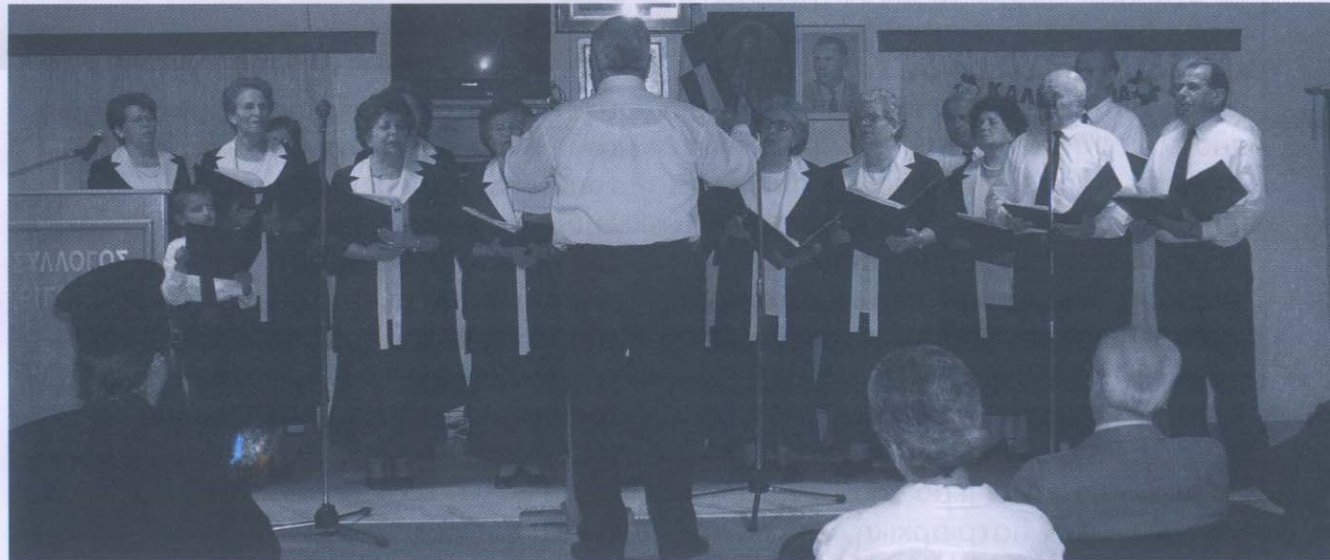
Η χορωδία του ΚΑΠΗ Νέας Τρίγλιας.

Την ολυμπιακή φλόγα υποδεχθήκαμε με τιμές αρχηγού κράτους. Ήταν ένα γεγονός, μοναδικό και για όσους είχαν τη τιμή να μεταφέρουν τη φλόγα και για όλους εμάς τους δημότες που είχαμε την τύχη να παρακολουθήσουμε τις λαμπρές εκδηλώσεις στην κατάμεστη πλατεία της Ν. Τρίγλιας.