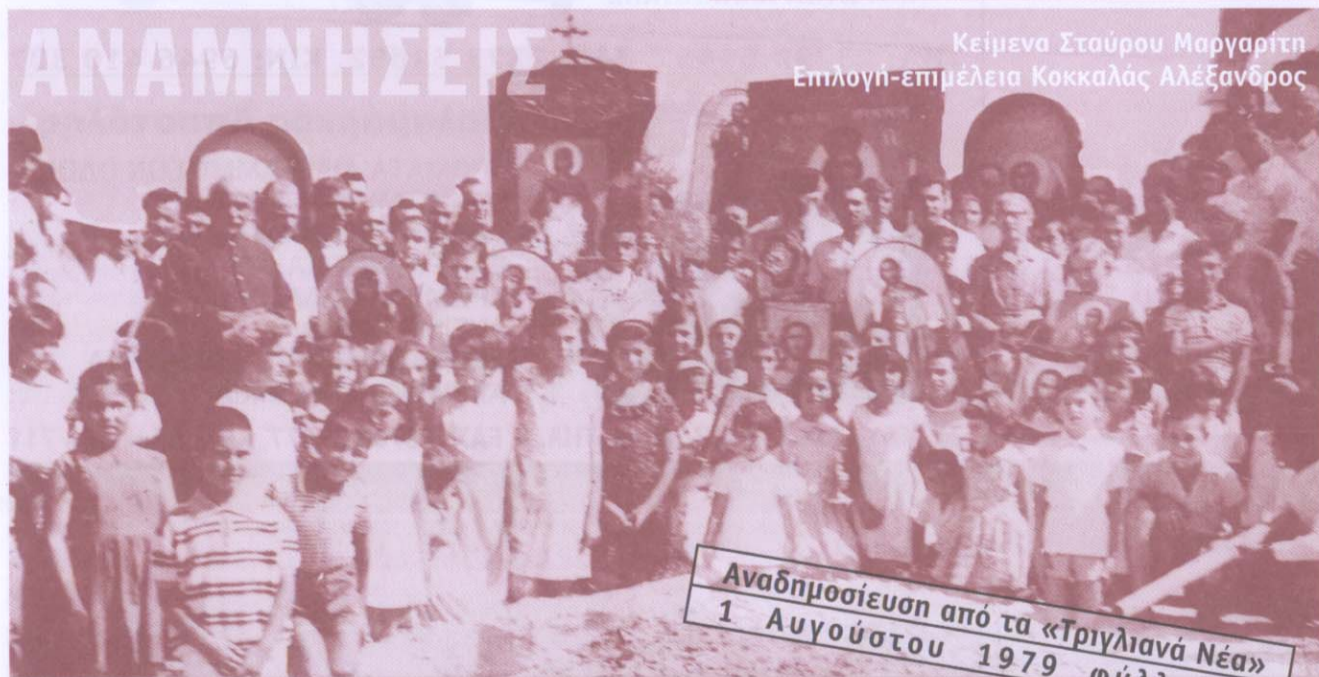
Κείμενα Σταύρου Μαργαρίτη Επιλογή-επιμέλεια Κοκκαλάς Αλέξανδρος

Αναδημοσίευση από τα «Τριγλιανά Νέα» 1 Αυγούστου 1979 φύλλο 21