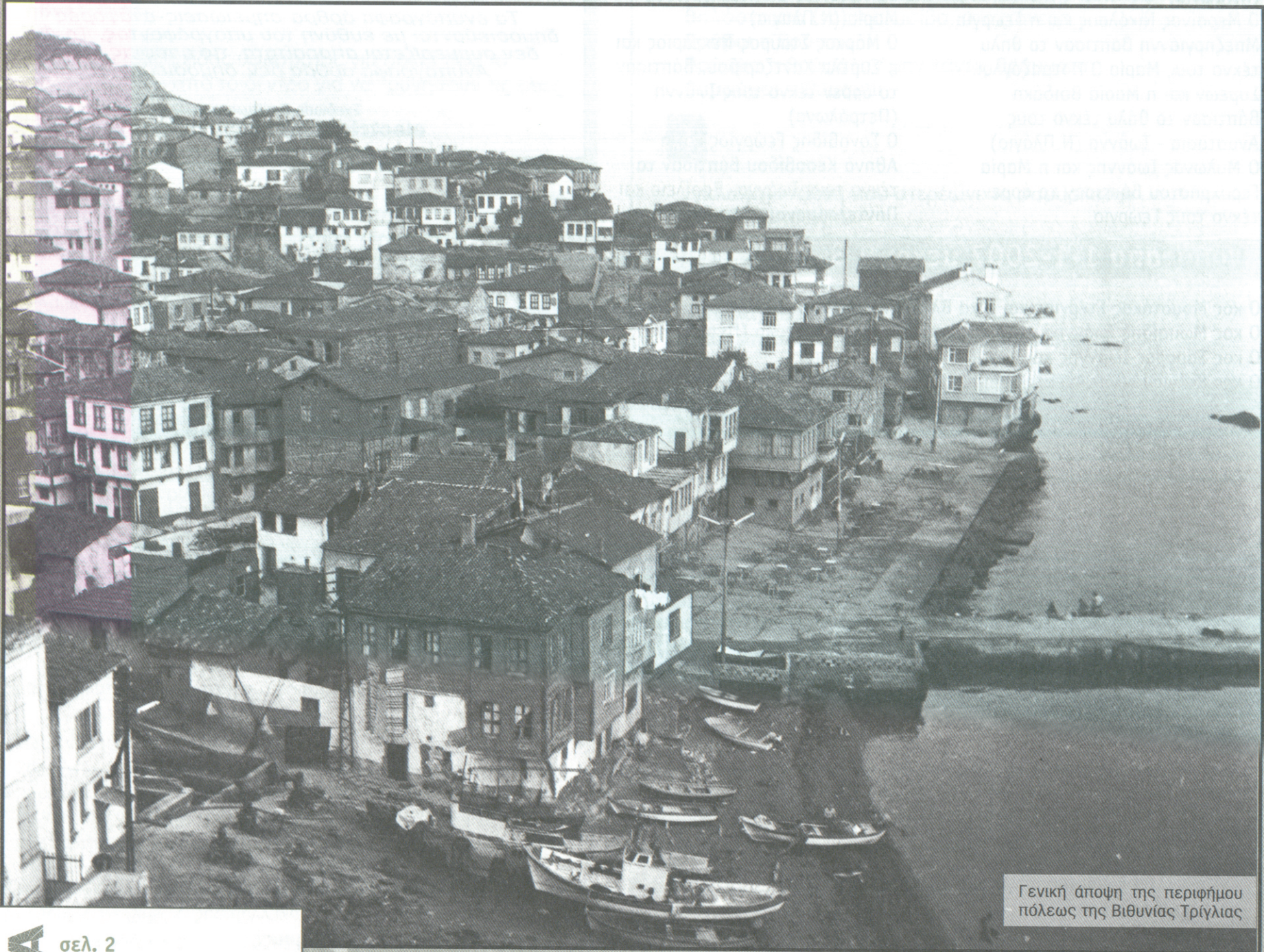
Γενική άποψη της περιφέρειας πόλεως της Βιθυνίας Τρίγλιας

ΕΦΗΜΕΡΙΔΑ ΤΟΥ ΣΥΛΛΟΓΟΥ ΤΩΝ ΑΠΑΝΤΑΧΟΥ ΤΡΙΓΛΙΑΝΩΝ