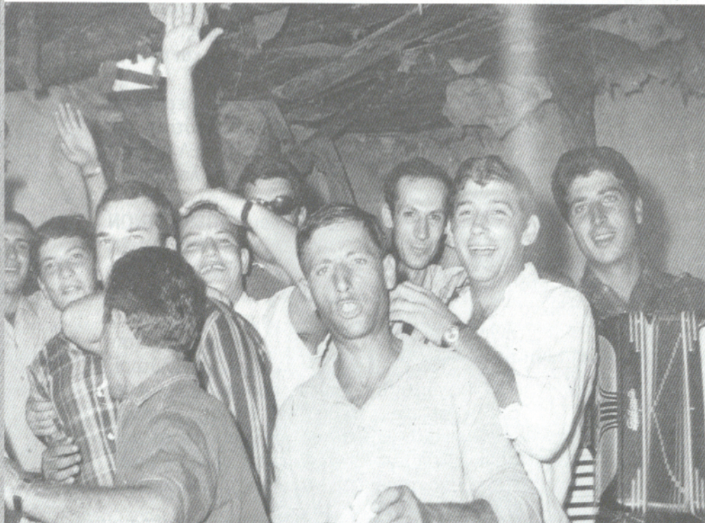
Φωτογραφία του γλεντιού από το αρχείο του Κ. Κокκαλά

Θ υμάμαι το Πάσχα του 1960, ήταν ένα ξεχωριστό Πάσχα και θα μου μείνει αξέχαστο, γιατί περιμέναμε τους Συχωριανούς μας από την Ραφήνα για να γιορτάσουμε μαζί. Είχε προηγηθεί επίσκεψη των Τριγλιανών την πρωτοχρονιά και είχε συμφωνηθεί το Πάσχα να έλθουν οι Ραφηνιώτες.