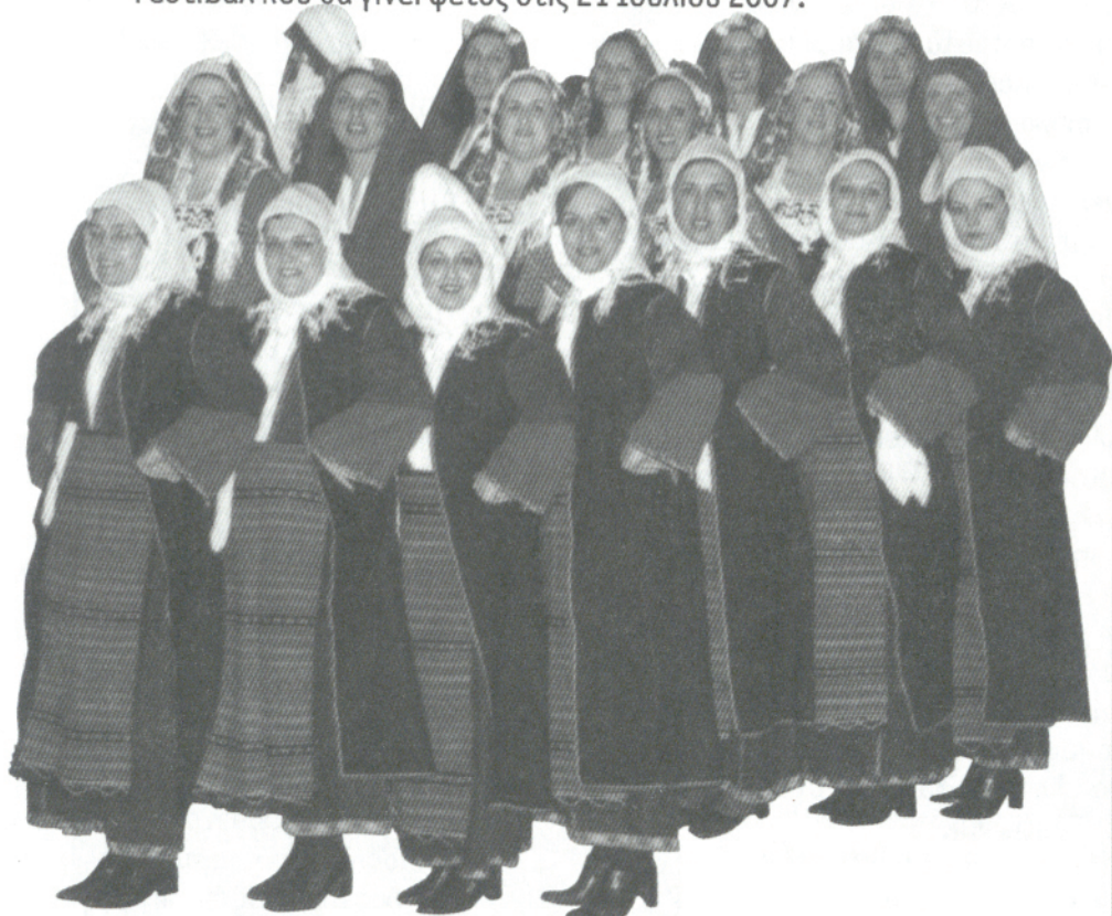
Φωτογραφία του χορευτικού τμήματος του Συλλόγου Νέων Ν. Τρίγλιας

Πολλά τμήματα του Συλλόγου έλαβαν μέρος σε διάφορες διοργανώσεις, μέσα στον Φεβρουάριο, όπως το καρναβάλι του Πολυγύρου, το παιδικό φεστιβάλ Πολυγύρου πάλι στον Πολύγυρο και το αντάμωμα στον Άγιο Μάμα. Ο Σύλλογος τώρα ξεκινάει τις προετοιμασίες του για τις εκδηλώσεις της Αγίας Παρασκευής και το Πανχαλκιδικιώτικο Φεστιβάλ που θα γίνει φέτος στις 21 Ιουλίου 2007.