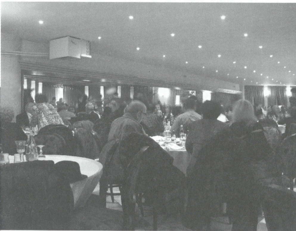
Επάνω: Στιγμιότυπο από τον χορό στην αίθουσα δεξιώσεων "Σαλιάρης"

Ο Σύλλογος ευχαριστεί, όλους του τριγλιανούς και τους φίλους που τίμησαν με την παρουσία τους την εκδήλωση καθώς και τους επαγγελματίες για τα δώρα που προσέφεραν για το χορό.