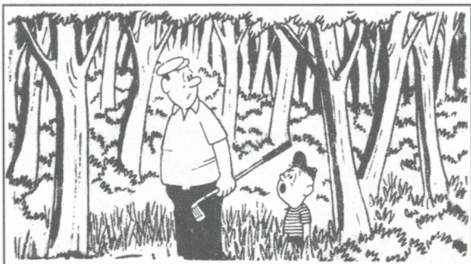
- "Ας αφήσουμε την μπάλα κι'ας βροθμε καλύτερα ποῦ εἶναι τό γήπεδο."