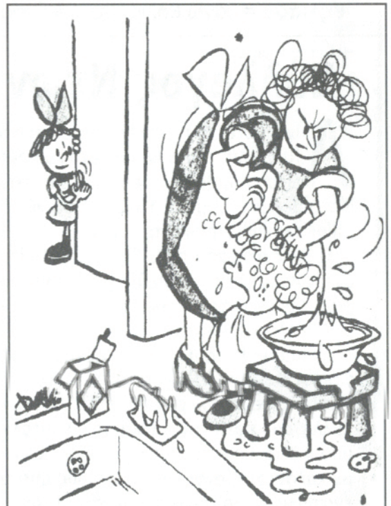
Δέν μπορώ νά έρθω τώρα. Μου κάνουν πλύση...έγκεφάλου!