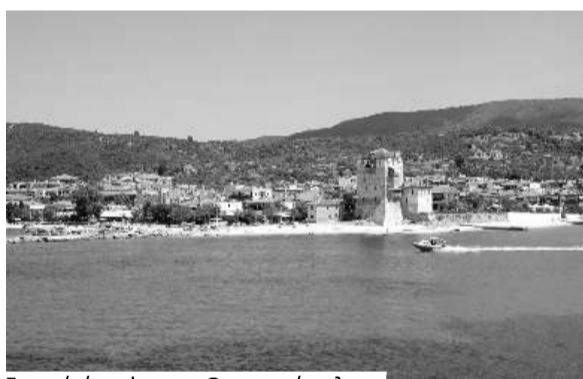
Γενική άποψη της Ουρανούπολης με τον χαρακτηριστικό πύργο της