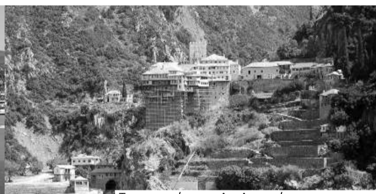
Το μοναστήρι του Αγ. Διονυσίου