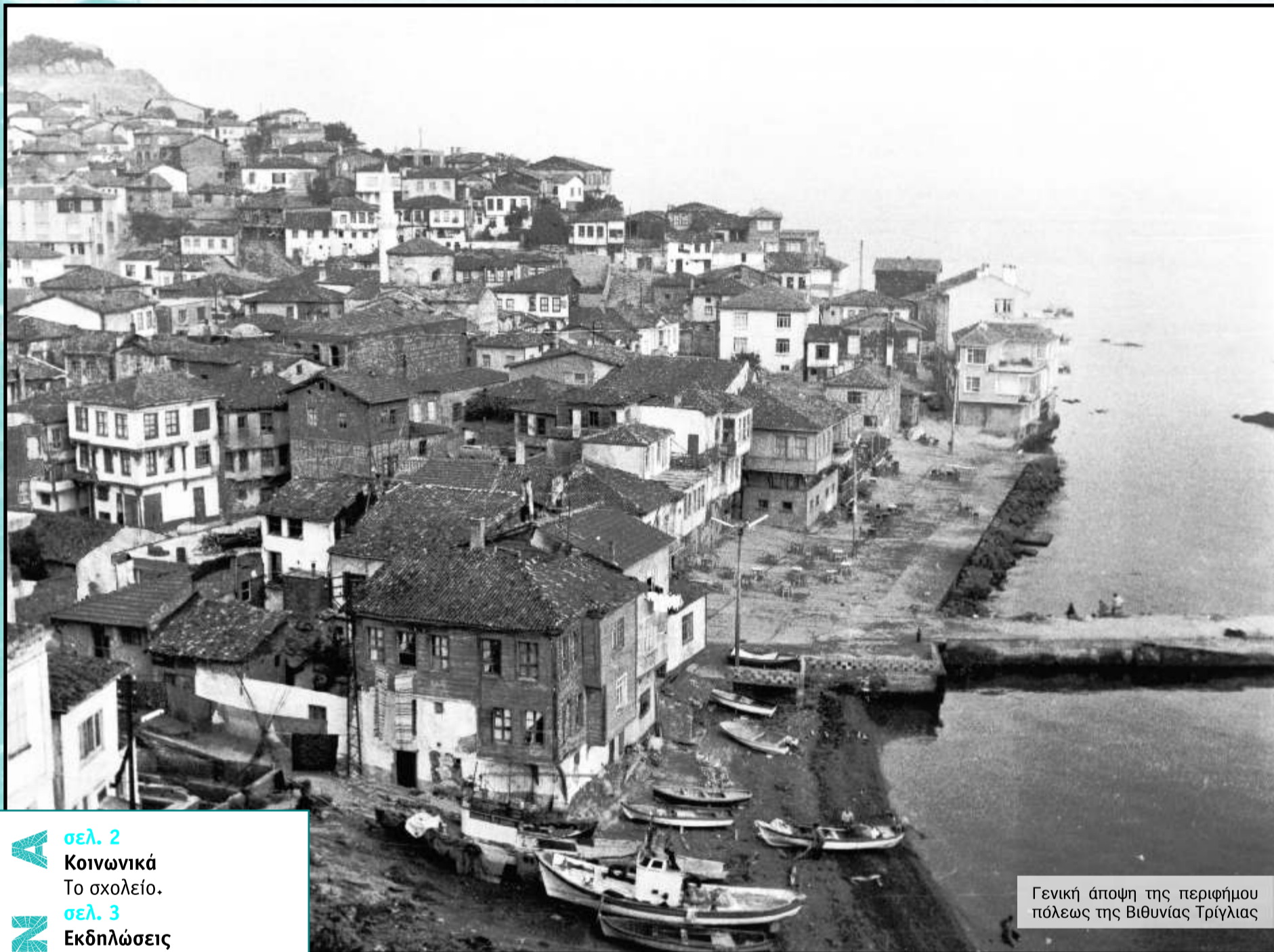
Γενική άποψη της περιφέρειας της Βιθυνίας Τρίγλιας

ΕΦΗΜΕΡΙΔΑ ΤΟΥ ΣΥΛΛΟΓΟΥ ΤΩΝ ΑΠΑΝΤΑΧΟΥ ΤΡΙΓΛΙΑΝΩΝ