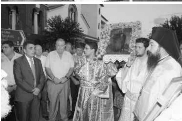
Φωτογραφίες από διάφορες εκδηλώσεις που έγιναν στην Ν. Τρίγλια.

κρασιατική ορχήστρα σκόρπισε κέφι στους φίλους και τα μέλη του Συλλόγου.