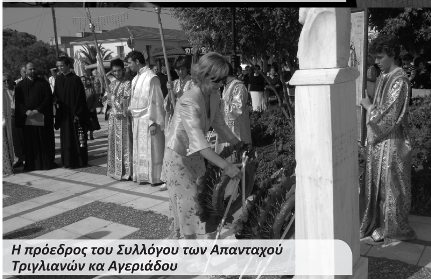
Η πρόεδρος του Συλλόγου των Απανταχού Τριγλιανών κα Αγεριάδου