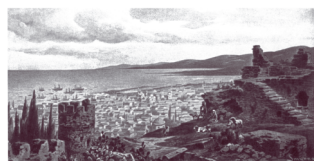
Επιμέλεια Πέτρος Στ. Μεχτιδής Ομορφες χώρες, χώρες ελληνικές ΚΩΝΣΤΑΝΤΙΝΟΥΠΟΛΗ, ΑΝΑΤΟΛΙΚΗ ΘΡΑΚΙΑ, ΘΡΑΚΙΑ, ΤΗΣ ΜΕΣΗΣ ΑΣΙΑΣ, ΚΑΠΠΑΔΟΚΙΑ, ΠΟΝΤΟΣ