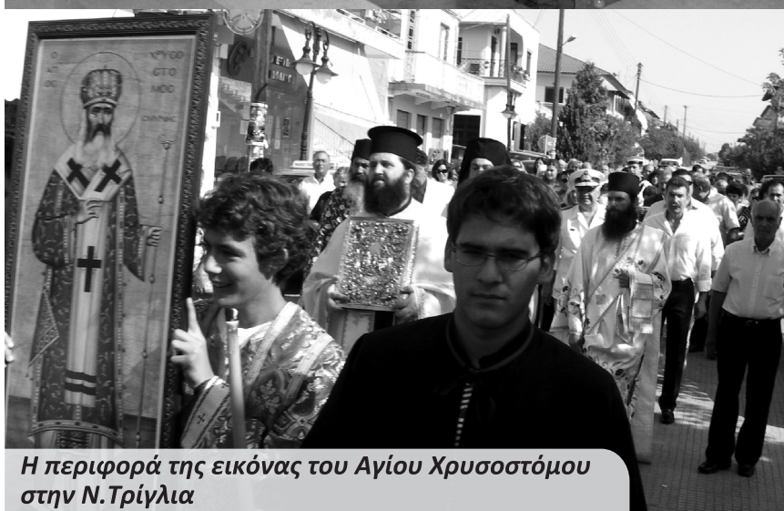
Η περιφορά της εικόνας του Αγίου Χρυσοστόμου στην Ν.Τρίγλια