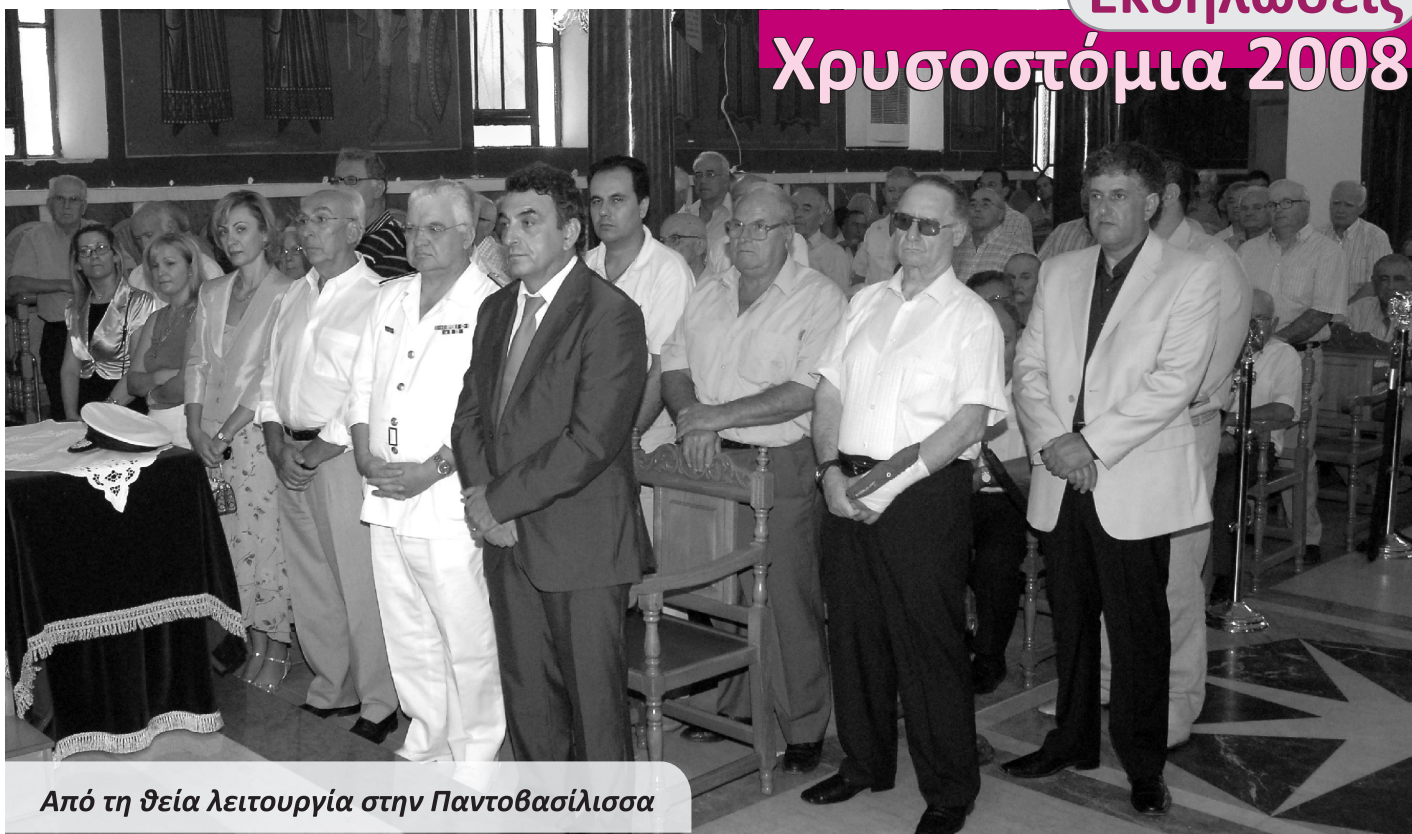
Από τη θεία λειτουργία στην Παντοβασιλίτσα