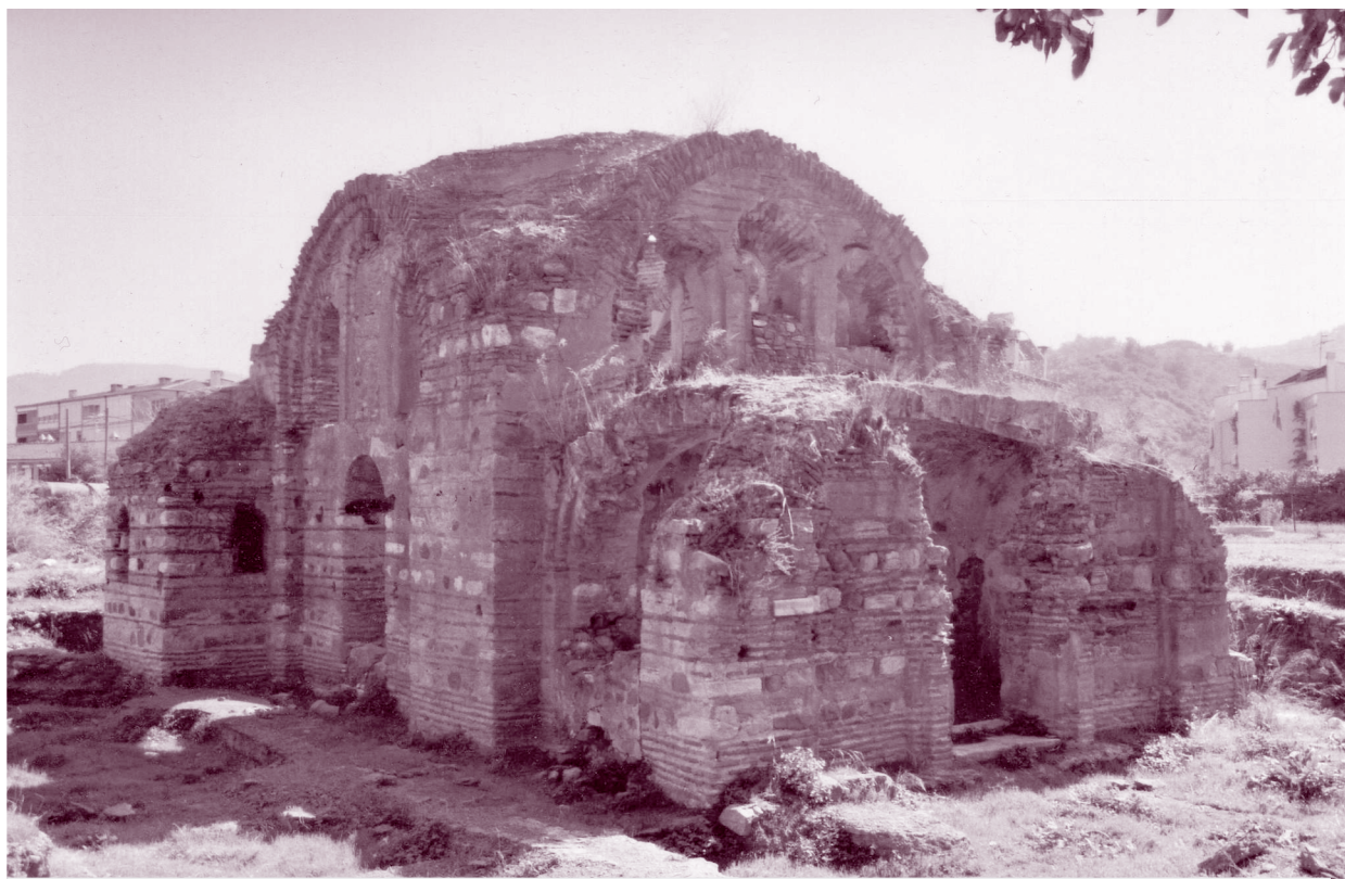
Φωτογραφία όπως είναι σήμερα ο ιερός ναός Αγίου Αβερκίου.

Αρχές φθινόπωρου και στην έδρα του Ευρωπαϊκού Κέντρου Βυζαντινών και Μεταβυζαντινών Μνημείων (Ε.Κ.Β.Μ.Μ.) στη Θεσσαλονίκη πραγματοποιήθηκε συνάντηση με θέμα το έργο "Αναστήλωση του καθολικού του μοναστηριού του Αγίου Αβερκίου", μνημείο του 6ου αιώνα, που βρίσκεται στο Δήμο ΕΛΕΓΜΩΝ (KURSUNLU) Μικράς Ασίας. Στη συνάντηση αυτή συμμετείχαν : ο δήμαρχος της