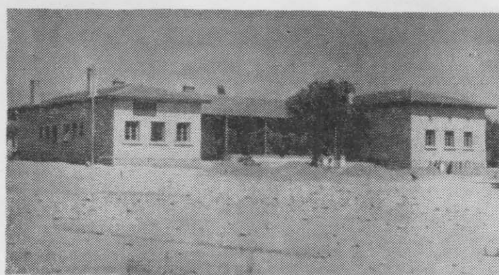
Τό παλαιό Κοινοτικό κατάστημα της Ν. Τρίγλιας