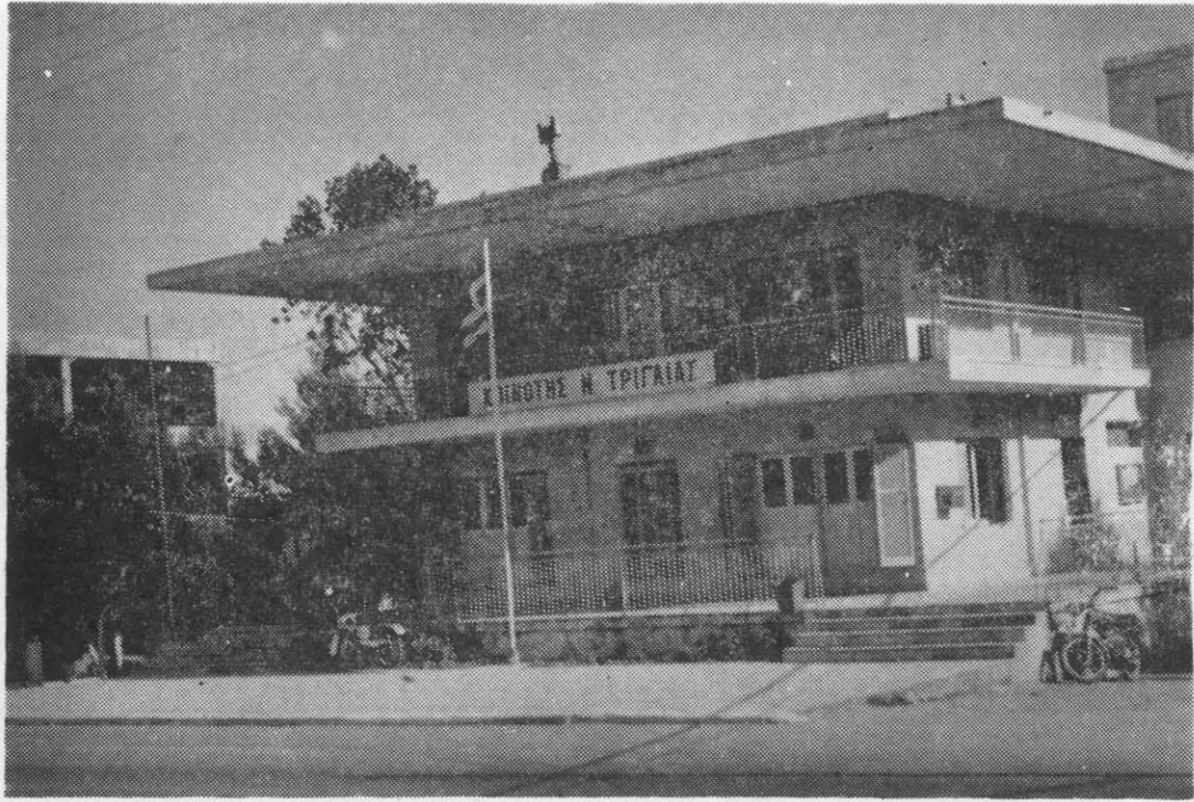
Τὸ ὄψαιότερο σημερινὸ Κοινοτικὸ Κατάστημα Ν. Τριγλίας