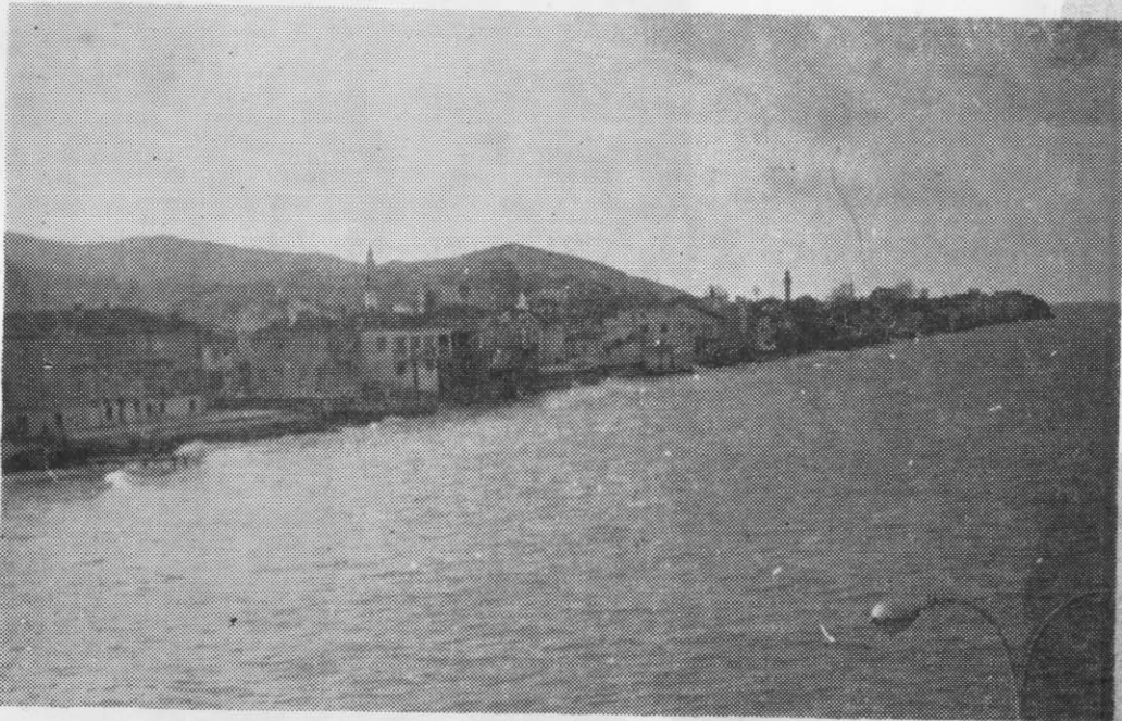
*Αποψὲς Παλαιὰ Τρίγλιας (ἢ Μύτη)