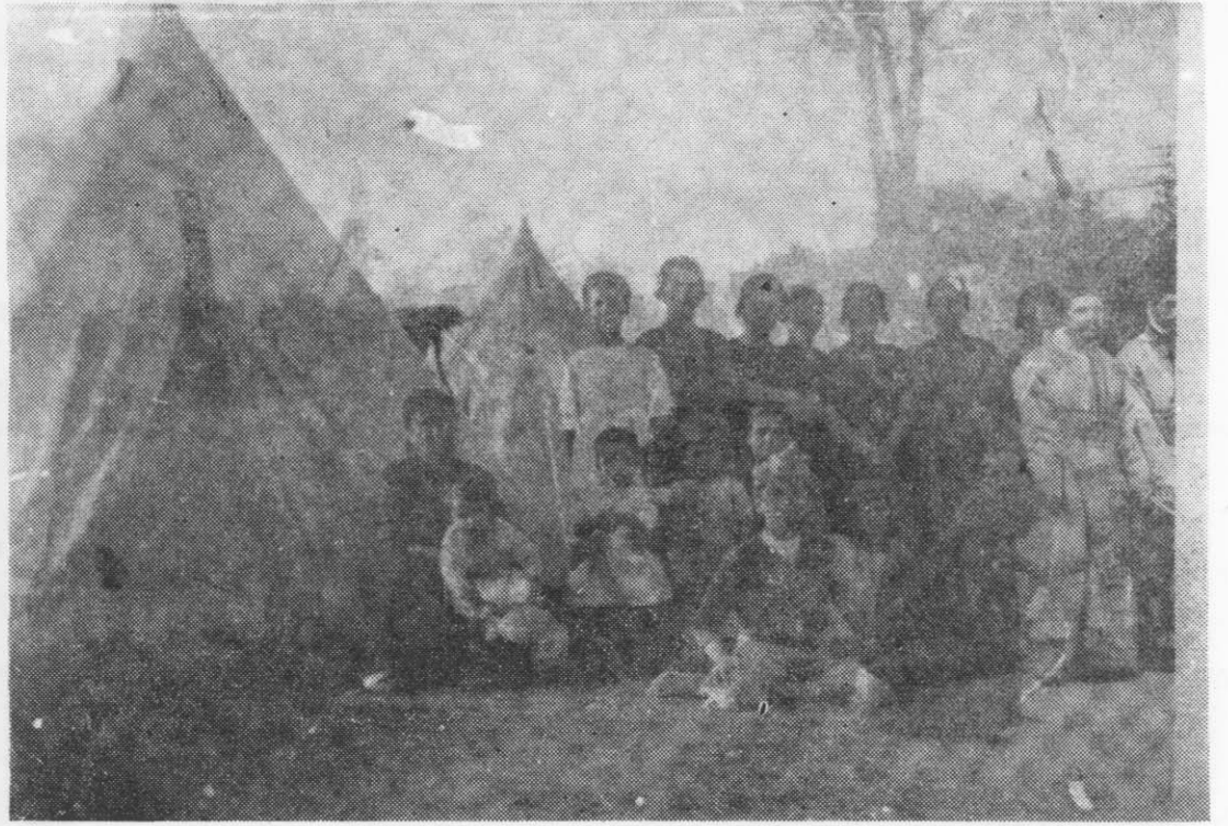
Ἰκκὸς ὄψαιότερο σημερινὸ Κοινοτικὸ Κατάστημα Ν. Τριγλίας