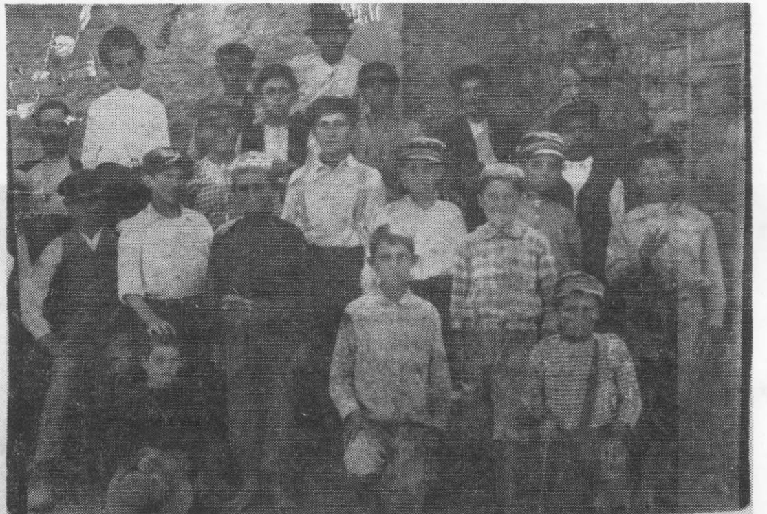
Οἱ πρῶτοι Τριγλιανοὶ μαθηταὶ στὸ Μετόχι Σουφλαρίου