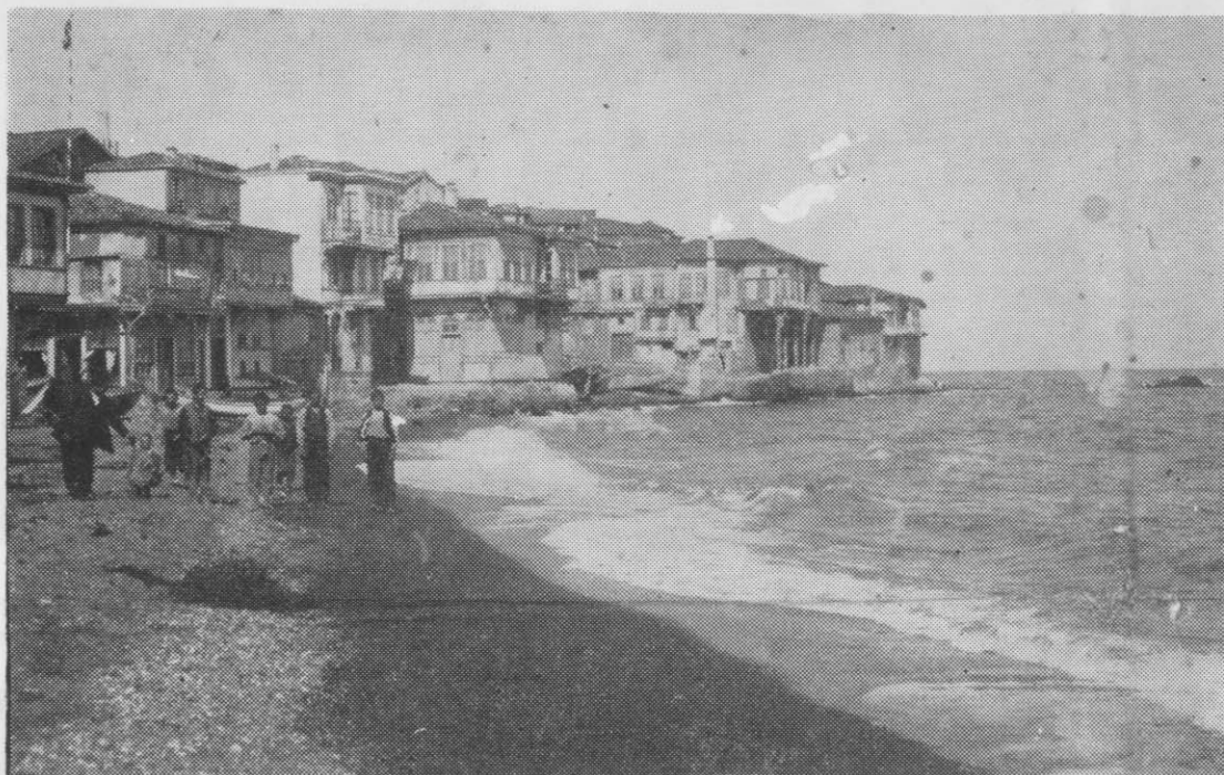
Μερική άποψις Π. Τρίγλιας