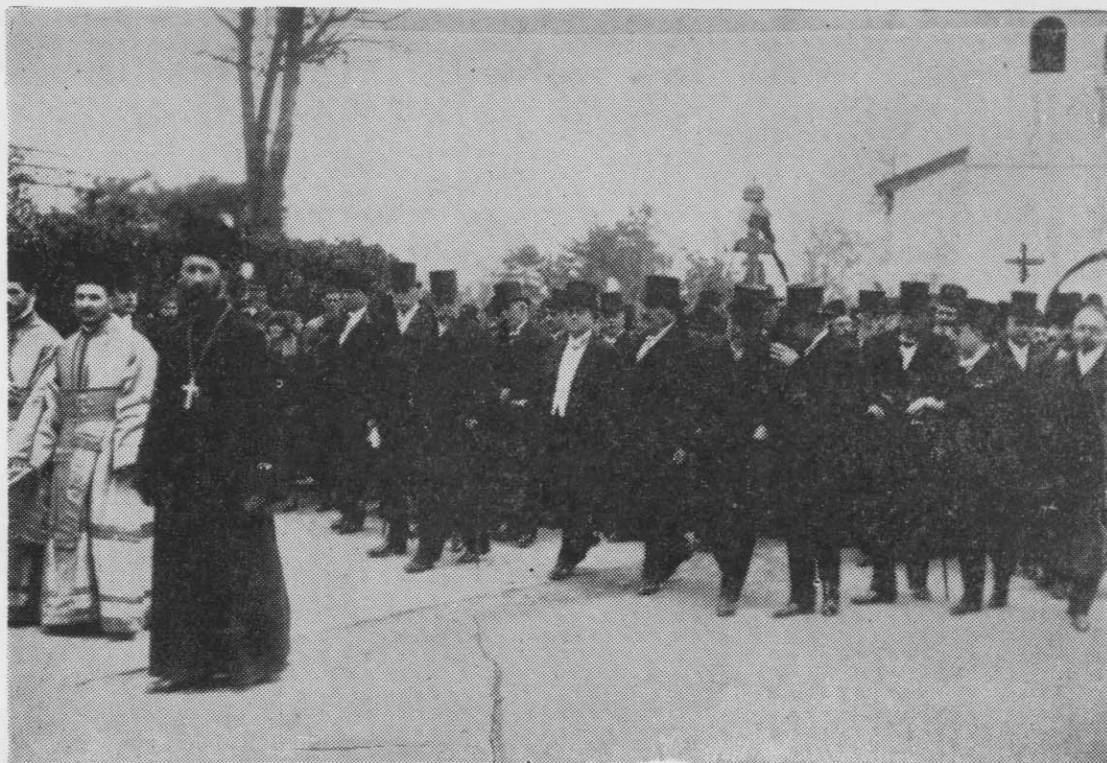
Ο έκλεκτός άειμνηστος συμπατριώτης μας σημειούμενος διά σταυρού και μεγάλου εοργέτης Ιωάννης Σάπαρης κατά μιάν τελετήν στον Βουκουρέστι κατά την ενθρόνισιν του Πατριάρχου Ρουμανίας