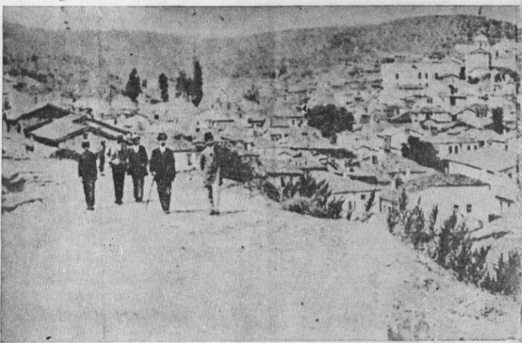
ΓΕΝΙΚΗ ΑΠΟΨΗ ΤΗΣ ΠΕΡΙΦΗΜΟΥ ΠΟΛΕΩΣ ΤΗΣ ΒΙΩΝΙΑΣ ΤΡΙΓΛΙΑΣ

Εμβόσματα και δημοσιεύσεις εις κ. ΓΑΒΡ. ΜΗΤΣΟΥ Κομνηνών 21, Θεσ) νίκη