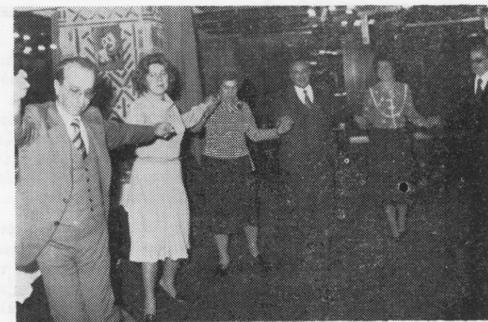
Από τον ετήσιον αποκριάτικον χορόν του Συλλόγου μας 4)3) 78