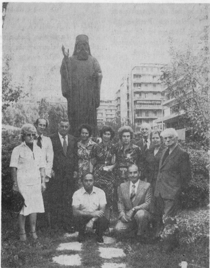
Το Διοικητικό Συμβούλιο του Συλλόγου Τριγλιανών Θεσσαλονίκης μετά των συμβούλων του Παραρτήματος Ν. Τρίγλιας, πρό του άνδριάντος του Χρυσοστόμου Σμύρνης

Εμπνευσμένη επιμνημόσυνη δμιλία εξεφώνησε ο εκλεκτός Πρόεδρος της Ένώσεως Σμυρναίων - Μικρασιατών δι-