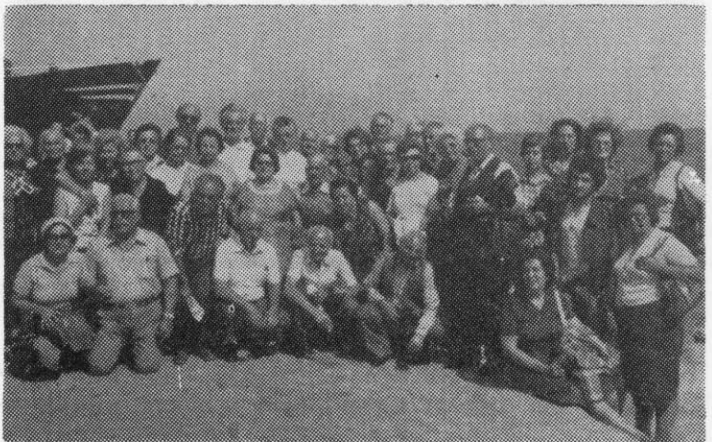
Ἡ ὀμάδα τῶν Παλλαδαρινῶν στὴν ἀποβάθρα τῶν Μουδαρινῶν, ὄπου ἔρριξαν λίγα τριαντάφυλλα στὴ μνήμη ὄλων ἐκείνων ποὺ χάθηκαν τὸν Αὔγουστο τοῦ 1922

Και με τὶς χαρταλάτσες τελειώνω γι' αὐτὴ τὴ φορά. Α. Π.