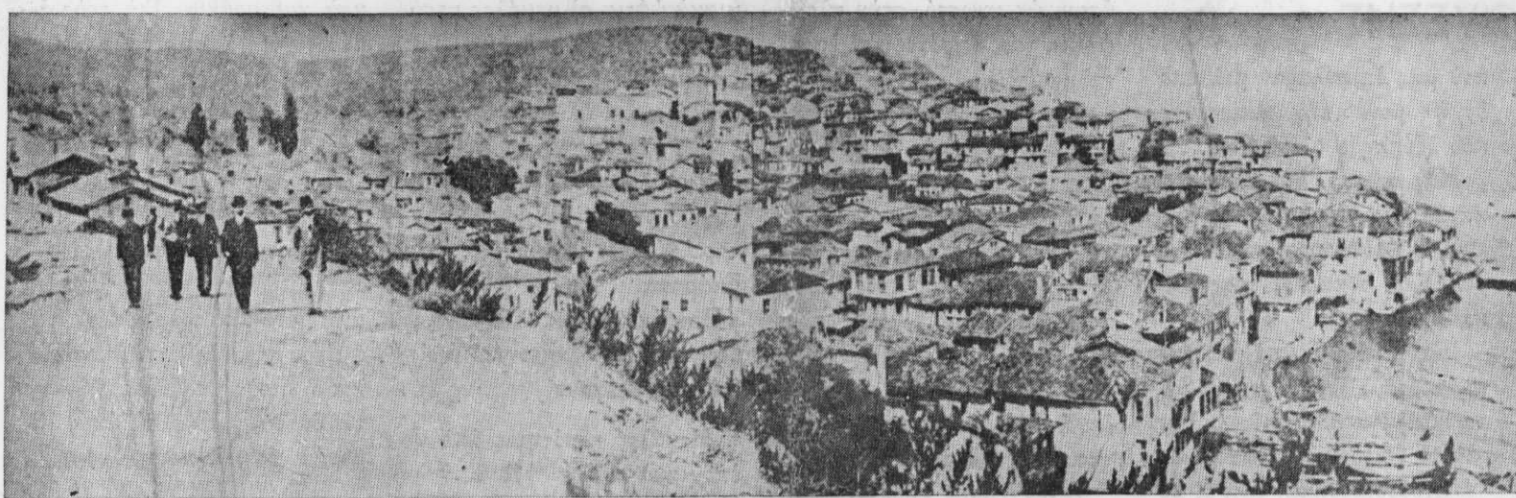
ΓΕΝΙΚΗ ΑΠΟΨΗ ΤΗΣ ΠΕΡΙΦΗΜΟΥ ΠΟΛΕΩΣ ΤΗΣ ΒΙΘΥΝΙΑΣ ΤΡΙΓΛΙΑΣ

Υπεύθυνοι: ΤΟ ΔΙΟΙΚΗΤΙΚΟ ΣΥΜΒΟΥΛΙΟ ΤΟΥ ΣΥΛΛΟΓΟΥ Υπεύθυνος Συντάξεως ΜΗΤΣΟΥ Ι.