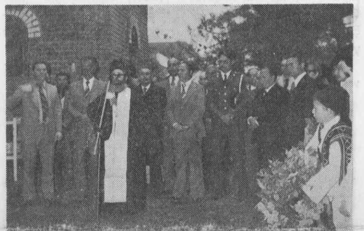
Από τάς εκδηλώσεις της 28ης Οκτωβρίου στη Ν. Τρίγλια

Η έθνική επέτειος της 28ης Οκτωβρίου 1940, στην όποια ή Τρίγλια έδωσε και ζωές και αίμα, γιορτάστηκε και φέτος με λαμπρότητα και ένθουσια- σμό. Στα Σχολεία μας όργα- νόθηκαν έσωτερικές γιορτές με πλούσιο πρόγραμμα και έ- θνικού περιεχομένου εκδηλώ- σεις, των όποιων κορύφωση ή-