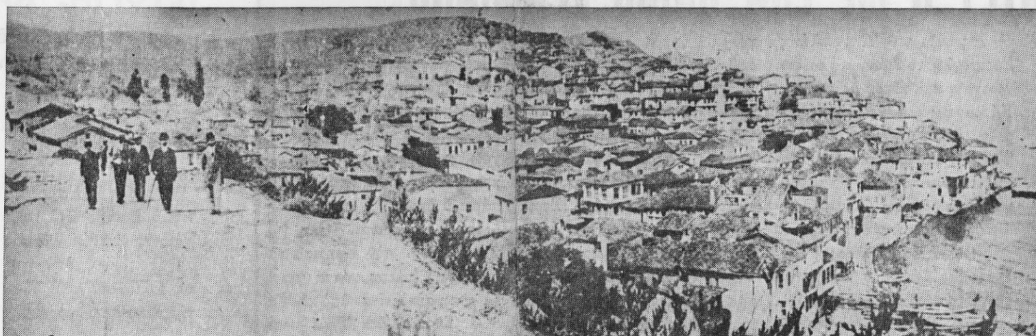
ΓΕΝΙΚΗ ΑΠΟΨΗ ΤΗΣ ΠΕΡΙΦΗΜΟΥ ΠΟΛΕΩΣ ΤΗΣ ΒΙΘΥΝΙΑΣ ΤΡΙΓΛΙΑΣ

Εμβόσματα και δημοσιεύσεις εις κ. ΓΑΒΡ. ΜΗΤΣΟΥ Κομνηνών 21, Θεσ/νίκη