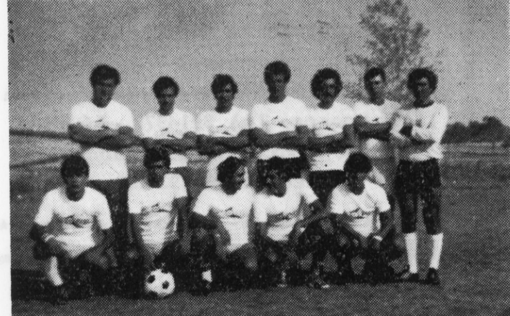
Ἡ νέα σύνθεσις τῆς ομάδος Π.Ο.Τ. Ν. Τρίγλιας

ποιοὶ γνωρίζοντας τὴς δυσκολίες γλου καὶ Χατζηκυριάκος δὲν πού τοὺς περιμένουν τὴς ξεπερνῶν καὶ ὀργανώνουν τὸν ὑπό διάλυση ἱστορικὸν σύλλογον με σκοπὸν στὴ νέα περίοδον νὰ τὸν ἐξαναφέρουν στὴ θέση πού τὸν ἀνήκει καὶ νὰ τὸν ἐπέκεινται ὅλοι νὰ παίξουν ἐνεργητικὸν ρόλον στὸ ποδόσφαιρον τῆς Χαλκιδικῆς.