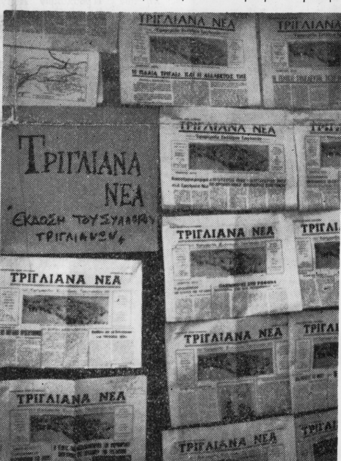
Άπό την Έκθεση Έπαρχιακού Τύπου που διοργάνωσε ή εφημερίδα «Μελέτι άλλαγής» της Ραφήνας. Άποψη της Έκθέσεως της εφημερίδας μας «Τριγλιανά Νέα»

τότε, σου έστειλα μία χαιρετιστήρια έπιστολή. Σου εύχομουν να άγκαλιάσεις σαν μάνα όλους τους διάσπαρτους Τριγλιανούς και κάτω από τις φτεροίγες σου (σελίδες έν προκειμένο) να γνωριστούν και ν' άδελφώσουν. Και αυτό νομίζω