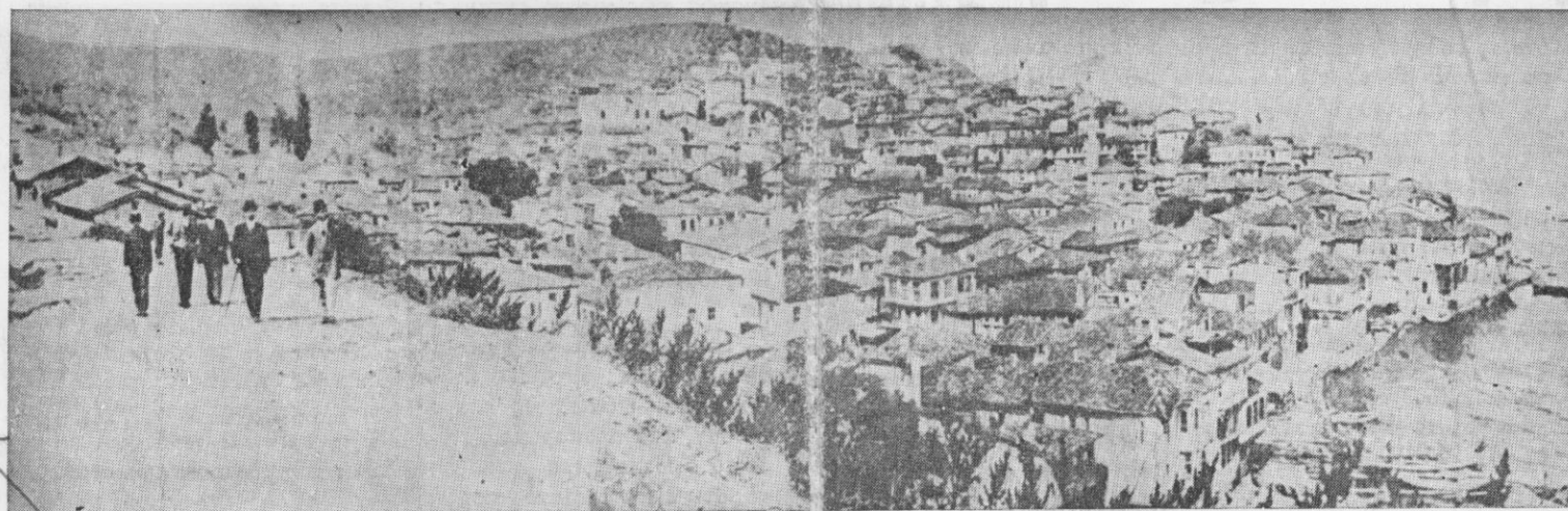
ΓΕΝΙΚΗ ΑΠΟΨΗ ΤΗΣ ΠΕΡΙΦΗΜΟΥ ΠΟΛΕΩΣ ΤΗΣ ΒΙΘΥΝΙΑΣ ΤΡΙΓΛΙΑΣ

ΕΚΔΙΔΕΤΑΙ ΑΝΑ ΔΙΜΗΝΟΝ ΠΑΡΑ ΤΟΥ ΣΥΛΛΟΓΟΥ ΤΡΙΓΛΙΑΝΩΝ