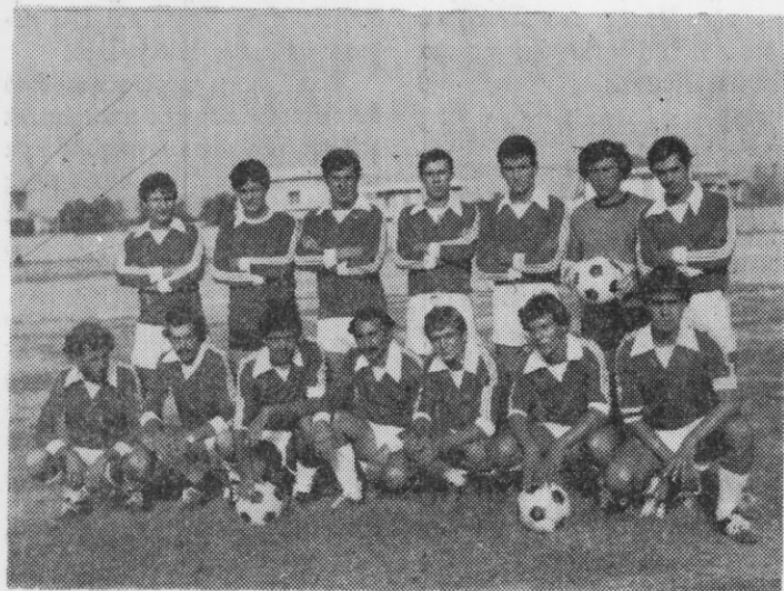
Η ομάδα του Π.Ο.Τ. Νέας Τρίγλιας περιόδου 1980—1981

Στά πλαίσια της οικονομικής ενίσχυσης του συλλόγου έχουν προγραμματισθεί οι παρακάτω εκδηλώσεις: