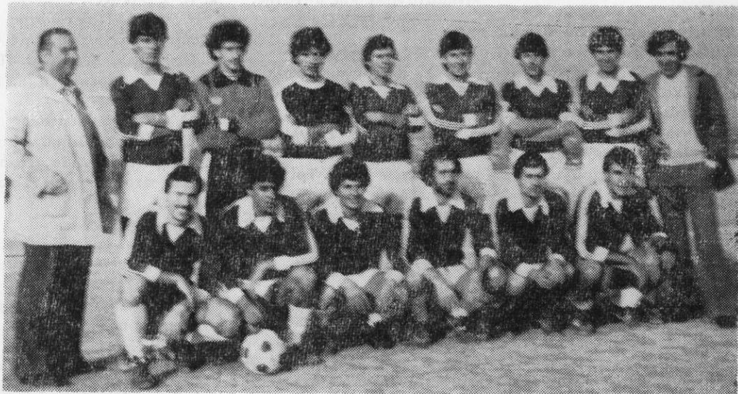
Η ομάδα του Π.Ο.Τ. που κατέκτησε το πρωτάθλημα Χαλκιδικής και ανέρχεται στην εθνική έρασιτεχνική κατηγορία

Νίκησε σε αγώνα μπαράζ τη Νίκη Πολυγύρου με 1 - 0