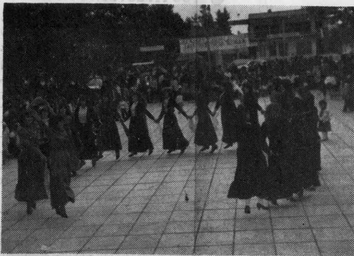
Το χορευτικό συγκρότημα πολιτιστικού συλλόγου Ν. Τρίγλιας

Αν βολτάριζες στην πλα-τεία τα χαράματα της Δευ-τέρας 23 Απριλίου, θα βρισκό-σουν μπροστά σ' ένα πρω-τόγνωρο θέαμα.