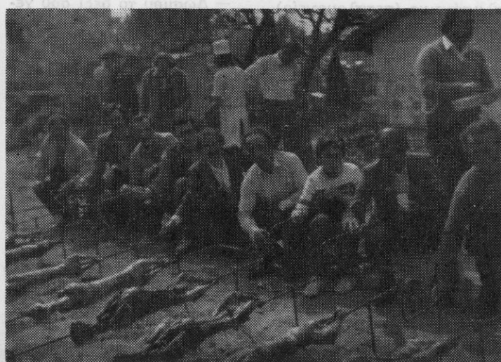
Την ώρα που ψήνονται τ' αρνιά

Τα γεροντάκια μας ταξι-δεύουν στο χρόνο. Πέρασαν εξήντα ολόκληρα χρόνια από τότε που οι παπούδες μας χό-ρευαν το χορό αυτό.