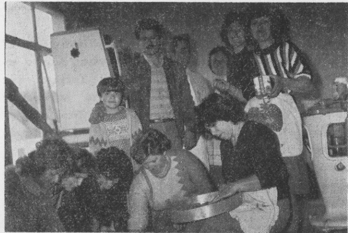
Οι συμπατριώτισσες με μεράκι ετοιμάζουν τα φαγητά και τις πίτες για το γλέντι στο φούρνο του κυρ-Ζαφειρή

Το λαϊκό γλέντι είναι και δικό μας. Είναι και πρέπει να