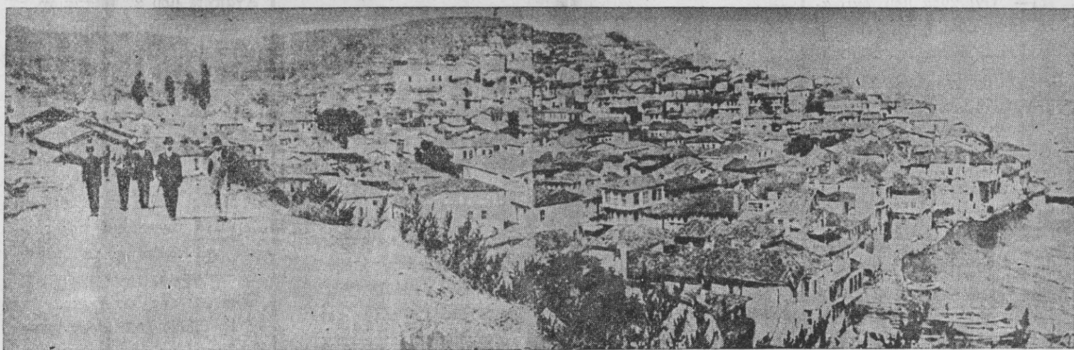
ΓΕΝΙΚΗ ΑΠΟΨΗ ΤΗΣ ΠΕΡΙΦΗΜΟΥ ΠΟΛΕΩΣ ΤΗΣ ΒΙΘΥΝΙΑΣ ΤΡΙΓΛΙΑΣ

ΕΚΔΙΔΕΤΑΙ ΑΝΑ ΔΙΜΗΝΟΝ ΠΑΡΑ ΤΟΥ ΣΥΛΛΟΓΟΥ ΤΡΙΓΛΙΑΝΩΝ