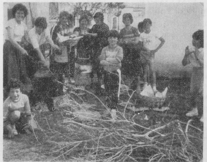
Το θάψιμο των αυγών από τις συμπατριώτισσές μας την κόκκινη Πέμπτη