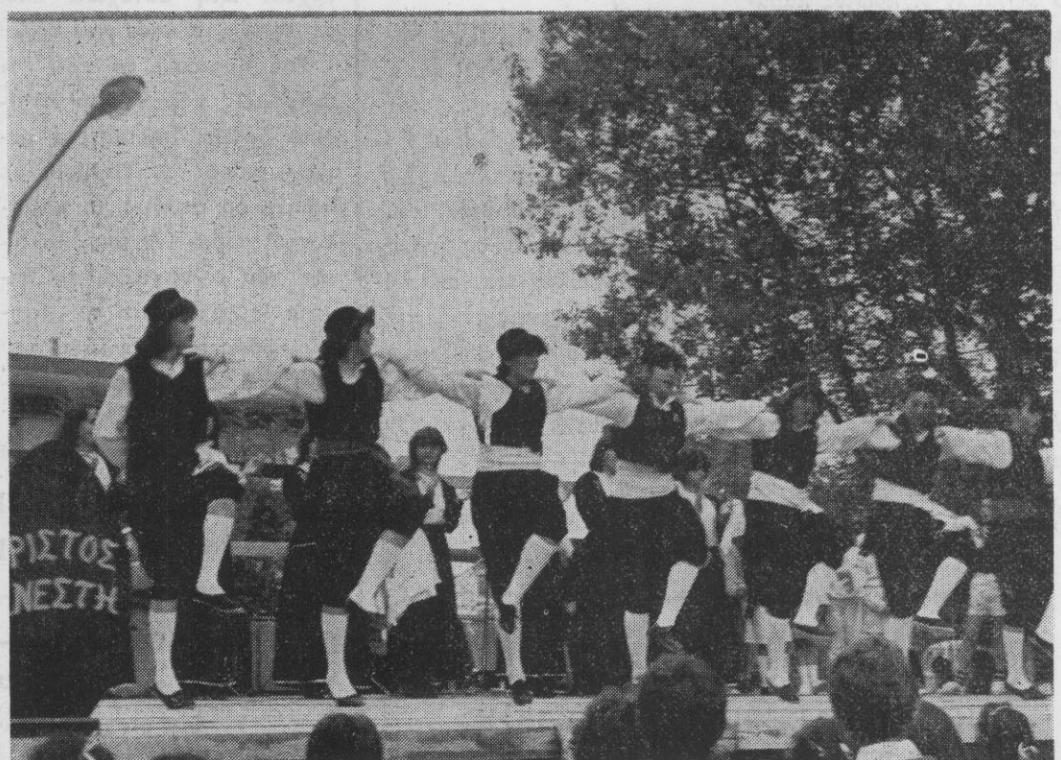
Το χορευτικό συγκρότημα του Πολιτιστικού Συλλόγου της Νέας Τρίγλιας, με την άφογη εμφάνισή του, ψυχαγόησε τον κόσμο στο γλέντι.