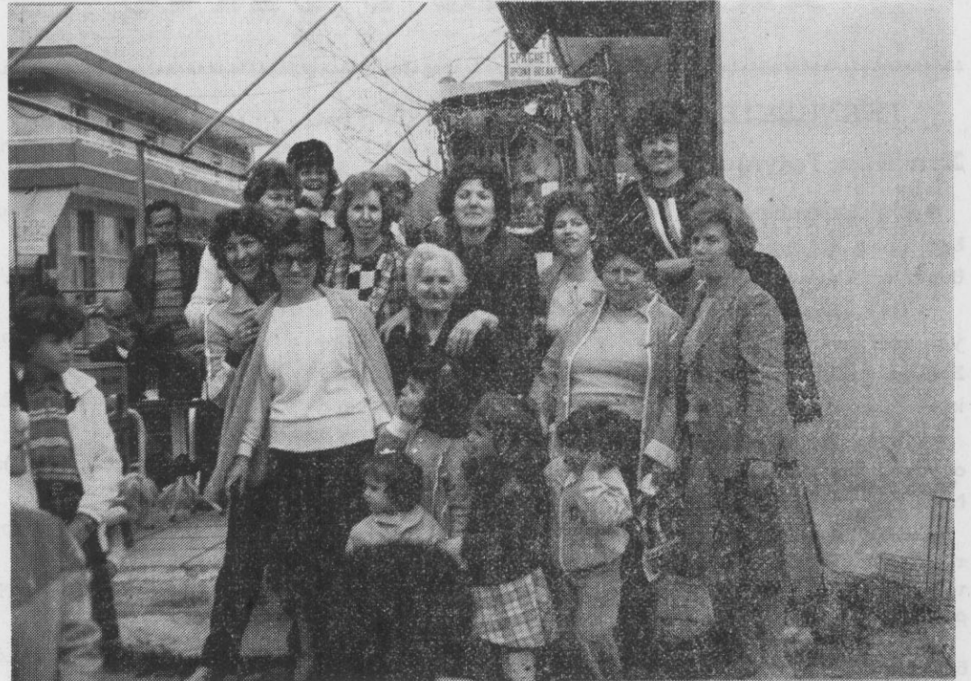
Για άλλη μια φορά η λατέρνα στόλισε το γλέντι θυμίζοντας παλιές καλές εποχές

Τα παλαιότερα χρόνια, τότε που οι συνθήκες ζωής ήταν πιο δύσκολες, οι άνθρωποι ήταν πιο αληθινοί, πιο ανοιχτό-