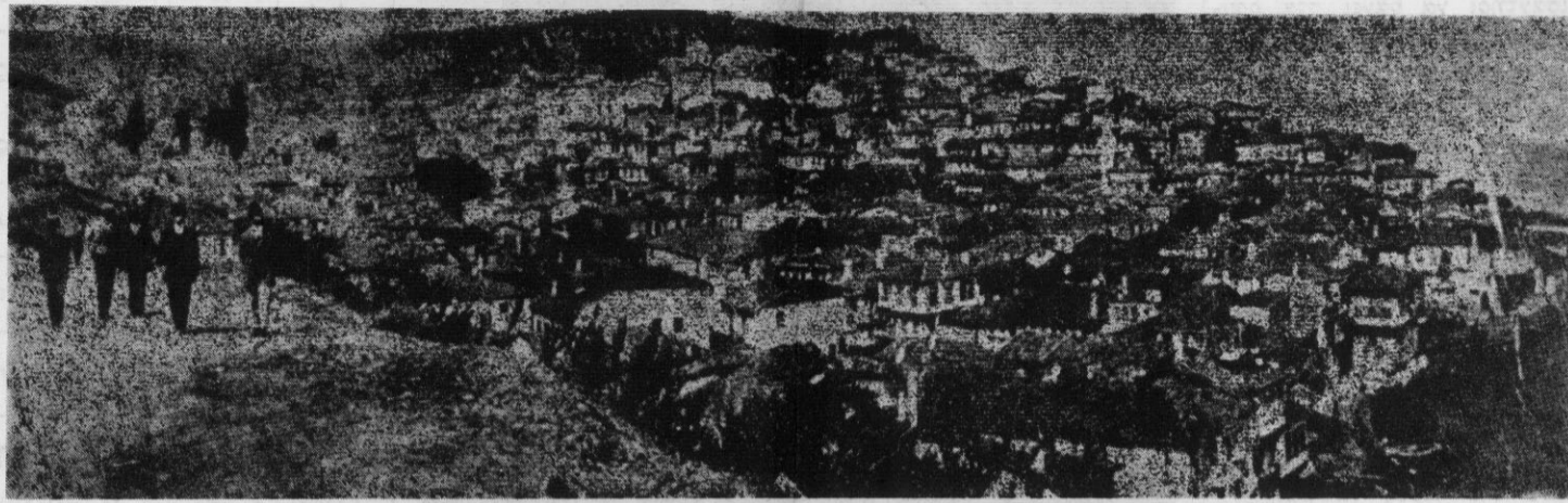
ΓΕΝΙΚΗ ΑΠΟΨΗ ΤΗΣ ΠΕΡΙΦΗΜΟΥ ΠΟΛΕΩΣ ΤΗΣ ΒΙΘΥΝΙΑΣ ΤΡΙΓΛΙΑΣ

ΕΚΔΙΔΕΤΑΙ ΚΑΘΕ ΔΙΜΗΝΟ ΑΠΟ ΤΟΝ ΣΥΛΛΟΓΟ ΤΡΙΓΛΙΑΝΩΝ