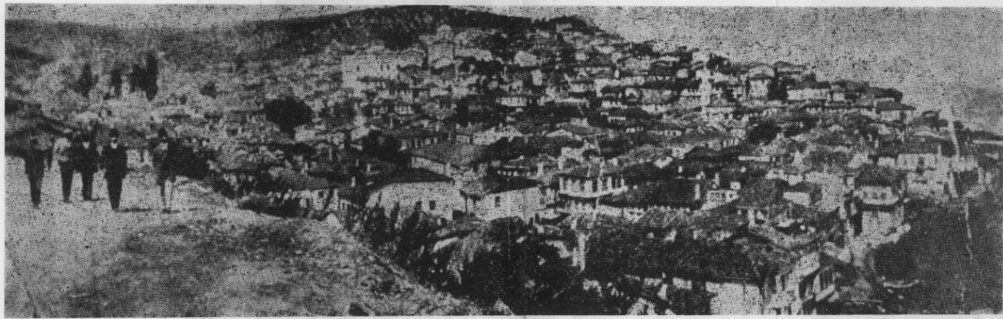
ΓΕΝΙΚΗ ΑΠΟΨΗ ΤΗΣ ΠΕΡΙΦΗΜΟΥ ΠΟΛΕΩΣ ΤΗΣ ΒΙΘΥΝΙΑΣ ΤΡΙΓΛΙΑΣ

ΕΚΔΙΔΕΤΑΙ ΚΑΘΕ ΔΙΜΗΝΟ ΑΠΟ ΤΟΝ ΣΥΛΛΟΓΟ ΤΡΙΓΛΙΑΝΩΝ