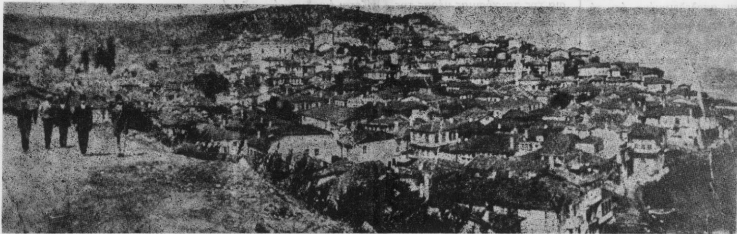
ΓΕΝΙΚΗ ΑΠΟΨΗ ΤΗΣ ΠΕΡΙΦΗΜΟΥ ΠΟΛΕΩΣ ΤΗΣ ΒΙΘΥΝΙΑΣ ΤΡΙΓΛΙΑΣ

ΕΚΔΙΔΕΤΑΙ ΚΑΘΕ ΔΙΜΗΝΟ ΑΠΟ ΤΟΝ ΣΥΛΛΟΓΟ ΤΡΙΓΛΙΑΝΩΝ