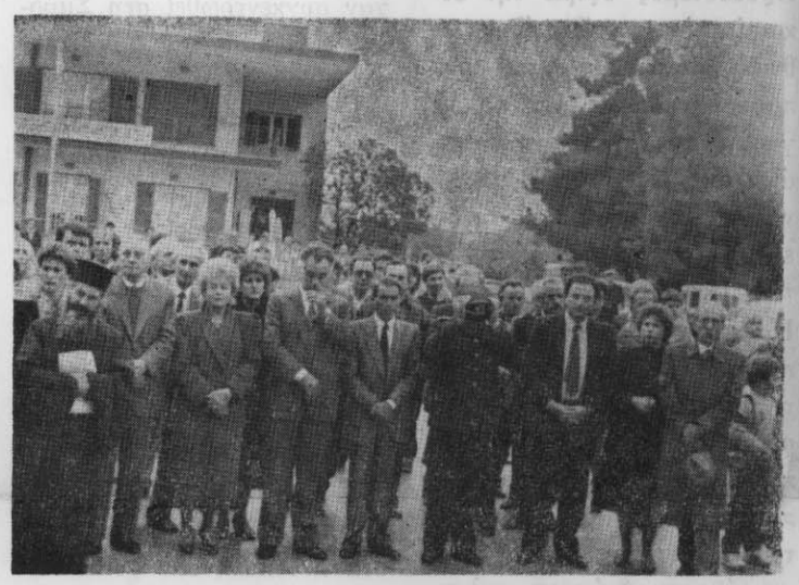
Άποψη από το πλήθος των προσκεκλημένων στο μνημόσυνο.

Εξαιρετική επιτυχία σημείωσαν οι εκδηλώσεις που έγιναν την Κυριακή 22 Νοεμβρίου στη Ν. Τρίγλια με αφορμή τη συμπλήρωση 65 χρόνων από το θάνατο του Τριγλιανού εθνομάρτυρα μητροπολίτη Χρυσοστόμου Σμύρνης.