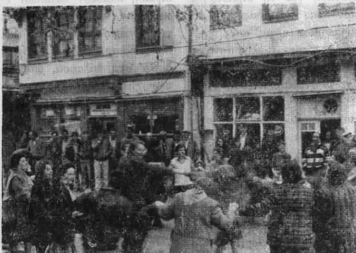
Χορός κάτω απ' τη βροχή. Χαμόγελα απ' όλους.

Έβρεχε όταν φτάσαμε στην Τρίγλια. Οι σημερινοί κάτοικοι της ειδοποιημένοι μας περιμέναν. Αρκετοί σφίξαν το χέρι παλιών γνώριμων, από τις προηγούμενες εκδρομές. Γρήγορα διαλυθήκαμε για να πάει ο καθένας στο σπίτι του παππού ή του πατέρα του.