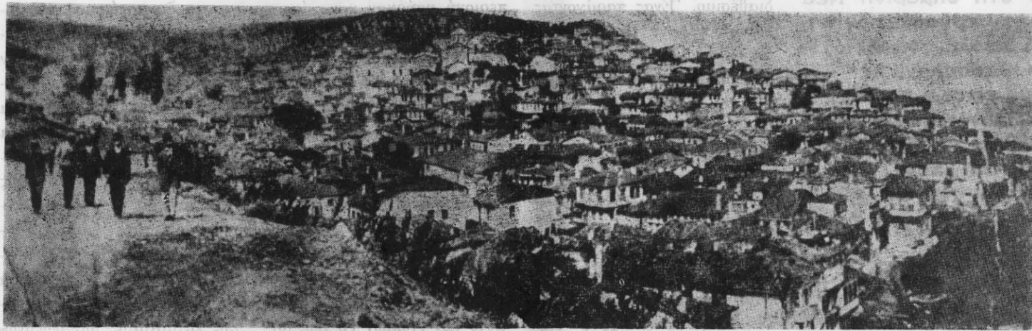
ΓΕΝΙΚΗ ΑΠΟΨΗ ΤΗΣ ΠΕΡΙΦΗΜΟΥ ΠΟΛΕΩΣ ΤΗΣ ΒΙΘΥΝΙΑΣ ΤΡΙΓΛΙΑΣ

ΕΚΔΙΔΕΤΑΙ ΚΑΘΕ ΔΙΜΗΝΟ ΑΠΟ ΤΟΝ ΣΥΛΛΟΓΟ ΤΡΙΓΛΙΑΝΩΝ