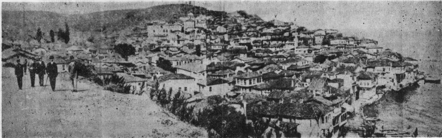
ΓΕΝΙΚΗ ΑΠΟΨΗ ΤΗΣ ΠΕΡΙΦΗΜΟΥ ΠΟΛΕΩΣ ΤΗΣ ΒΙΘΥΝΙΑΣ ΤΡΙΓΛΙΑΣ

ΕΚΔΙΔΕΤΑΙ ΚΑΘΕ ΔΙΜΗΝΟ ΑΠΟ ΤΟΝ ΣΥΛΛΟΓΟ ΤΡΙΓΛΙΑΝΩΝ ★ Υπεύθυνοι: ΤΟ ΔΙΟΙΚΗΤΙΚΟ ΣΥΜΒΟΥΛΙΟ ΤΟΥ ΣΥΛΛΟΓΟΥ Υπεύθυνος Σύνταξης: ΚΟΤΣΑΣΤΡΑΤΗ ΜΕΛΠΩ ★ Εμβάσματα και δημοσιεύσεις ΚΟΤΣΑΣΤΡΑΤΗ ΜΕΛΠΩ Κομνηνών 21, Θεσσαλονίκη