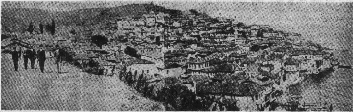
ΓΕΝΙΚΗ ΑΠΟΨΗ ΤΗΣ ΠΕΡΙΦΗΜΟΥ ΠΟΛΕΩΣ ΤΗΣ ΒΙΘΥΝΙΑΣ ΤΡΙΓΛΙΑΣ

ΕΚΔΙΔΕΤΑΙ ΚΑΘΕ ΔΙΗΜΝΟ ΑΠΟ ΤΟΝ ΣΥΛΛΟΓΟ ΤΡΙΓΛΙΑΝΩΝ