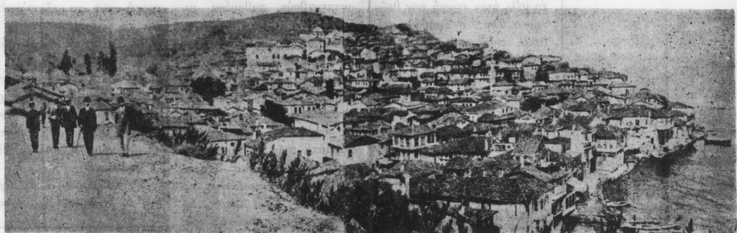
ΓΕΝΙΚΗ ΑΠΟΨΗ ΤΗΣ ΠΕΡΙΦΗΜΟΥ ΠΟΛΕΩΣ ΤΗΣ ΒΙΘΥΝΙΑΣ ΤΡΙΓΛΙΑΣ

ΕΚΔΙΔΕΤΑΙ ΚΑΘΕ ΔΙΜΗΝΟ ΑΠΟ ΤΟΝ ΣΥΛΛΟΓΟ ΤΡΙΓΛΙΑΝΩΝ ★ Υπεύθυνος Σύνταξης: ΤΟ ΔΙΟΙΚΗΤΙΚΟ ΣΥΜΒΟΥΛΙΟ ΤΟΥ ΣΥΛΛΟΓΟΥ Επιμέλεια Ύλης: ΒΑΚΑΛΟΠΟΥΛΟΣ ΚΩΝ/ΝΟΣ ★ Εμβάσματα - δημοσιεύσεις: ΚΑΡΑΤΣΗ ΛΕΜΟΝΙΑ Κομνητών 21, Τηλ. 236.206 Θεσσαλονίκη