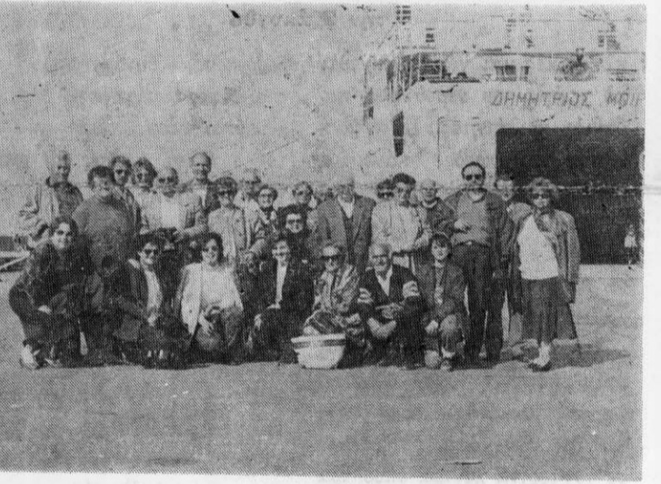
Στην Κυλήνη ώρα για επιβίβαση στο Φέρι Μποτ

χουν επίσης αερογραμμές του Κουτούζη και του Δοξαρά. Επισκεφθήκαμε και άλλες εκκλησίες, από τις πολλές που υπάρχουν, και κατάφεραν μάλιστα να αντέξουν τους σεισμούς του '53. Όσο για μουσεία υπάρχουν αρκετά: Το βυζαντινό