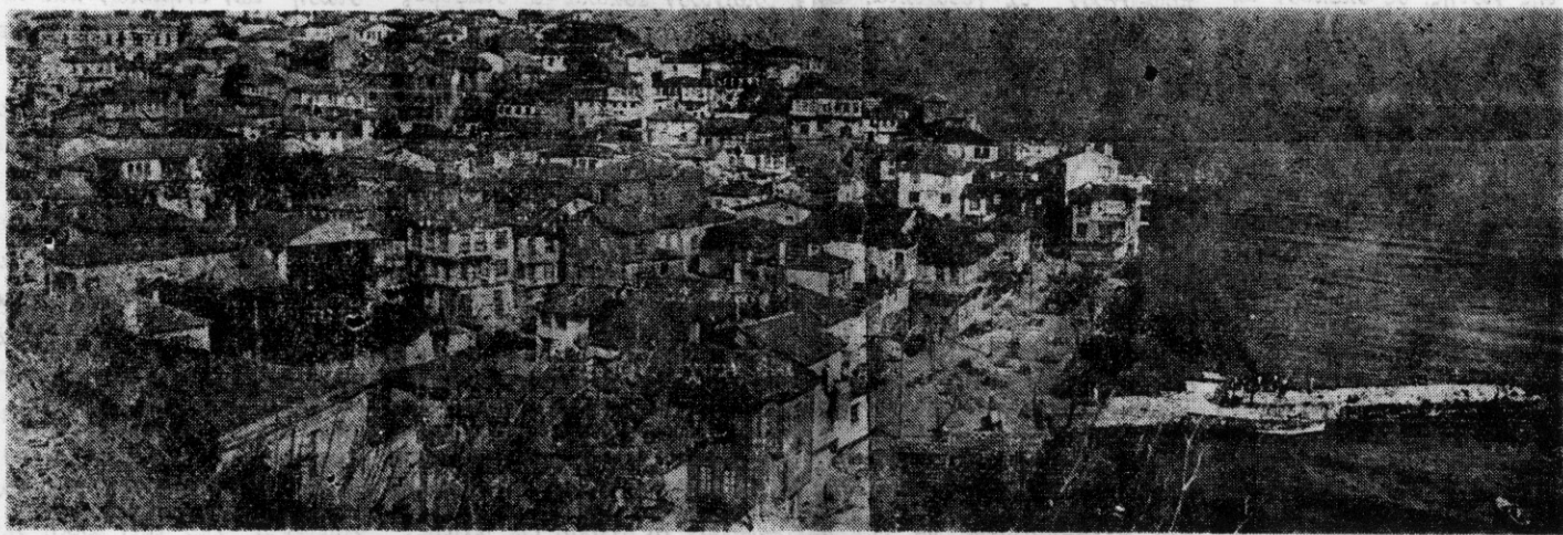
Γενική άποψη της περιφέρειας πόλεως της Βεθουνίας Τρίγλιας

ΕΚΔΙΔΕΤΑΙ ΚΑΘΕ ΔΙΜΗΝΟ ΑΠΟ ΤΟ ΣΥΛΛΟΓΟ ΤΡΙΓΛΙΑΝΩΝ