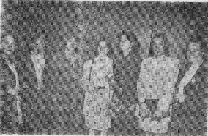
Από την τιμητική διάκριση

και άλλες τέτοιες φωνές και να εγκαθιδυνθούν οι προσπάθειες για τη δημιουργία θιώσιμων πολιτισμικών κοινοτήτων.