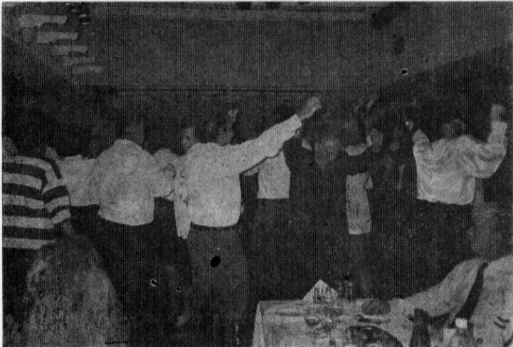
Από τον Αποκριάτικο χορό του Συλλόγου

Από ευχαριστήσουμε όλους εσάς που ανταποκριθήκατε στο κάλεσμά μας, όλους όσους προσέφεραν τα πολλά και ωραία δώρα, καθώς και όλους όσους βοήθησαν στην προετοιμασία αυτού του χορού, ευχόμεστε και τον επόμενο χρόνο ο χορός μας να έχει την ίδια ή και μεγαλύτερη επιτυχία από τη φετινή.