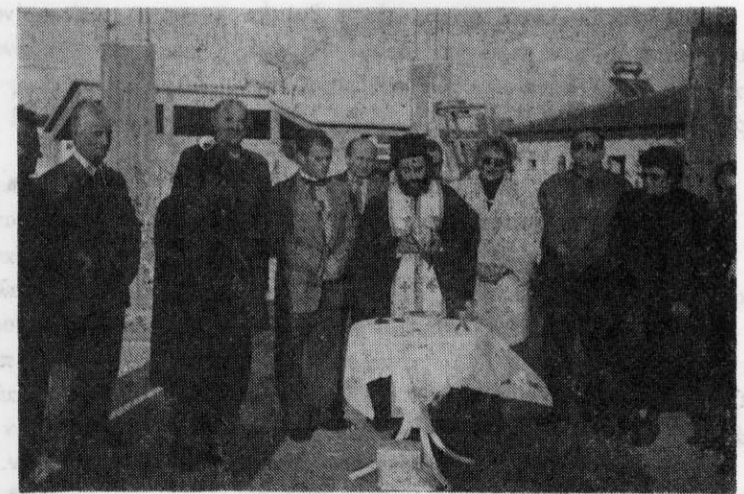
Αγιασμός Πολιτιστικού Κέντρου — Λαογραφικού Μουσείου Συλλόγου Τριγλιανών 18.12.1994

Το Πολιτιστικό Κέντρο, με εμβαδόν 350 τ.μ., θα περιλαμβάνει αίθουσα διαλέξεων - δεξιώσεων, Λαογραφικό Μουσείο, Δοξολογική Βιβλιοθήκη, γραφείο που θα στεγαστεί τα