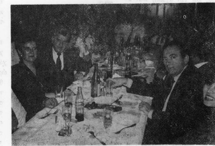
Χορός Παραρτήματος Συλλόγου Τριγλιανών Κόψιμο πίττας 4.1.1995