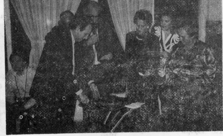
Κόψιμο πίττας 4.1.1995