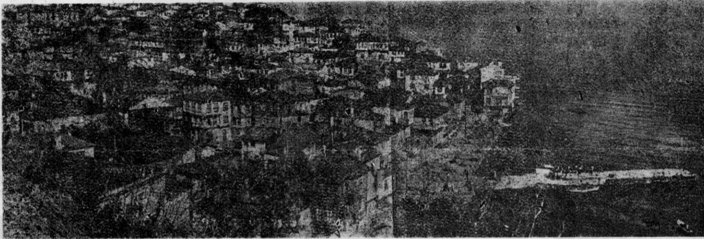
Γενική άποψη της περιφέρειας πύλεως της Βεθουσίας Τρίγλιας

ΕΚΔΙΔΕΤΑΙ ΚΑΘΕ ΔΙΜΗΝΟ ΑΠΟ ΤΟ ΣΥΛΛΟΓΟ ΤΡΙΓΛΙΑΝΩΝ