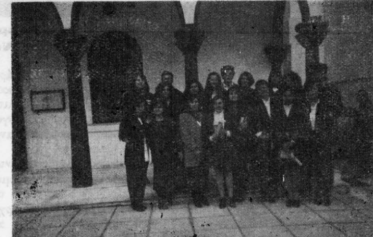
Στελέχη Ενοριακών Πνευματικών Κέντρων Νέας Τρίγλιας

Εκπαιδευτήρια Η Γ ΜΑCΙΝΤ. Μητράγγια Γεώργιο — βιβλιοθηκονόμο. Σαπουντζή Σωτήριο — καθηγήτρια εκπαιδευτή Η Γ. VAN DER AVERAR Χρυσού-