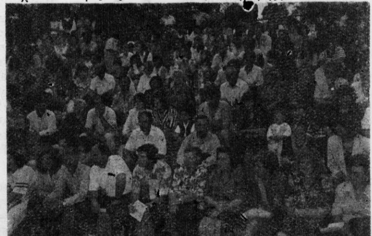
Είχε γεμίσει το Αμφιθέατρο της Αγίας Παρασκευής στη γιορτή Νεολαίας '95

πνεύμα ελεύθερης συμμετοχής σε ένα θέαμα της ποιότητας και της πολυσχιδέτητας αυτού της 28ης Μαΐου. Συγχρόνως, όμως, η διαπίστωση αυτή αποτελεί την απόδειξη των ατελείωτων ή καλύτερα ανυπάρχοντων προσπαθειών της κοινότητας της Ν. Τρίγλιας για πολιτιστική ανάπτυξη. Η ανάγκη μιας τέτοιας οργανωμένης κίνησης προβάλλει επιτακτική γιατί η ψυχή του πολιτισμού είναι ο πολιτισμός της ψυχής, κι αυτός δεν