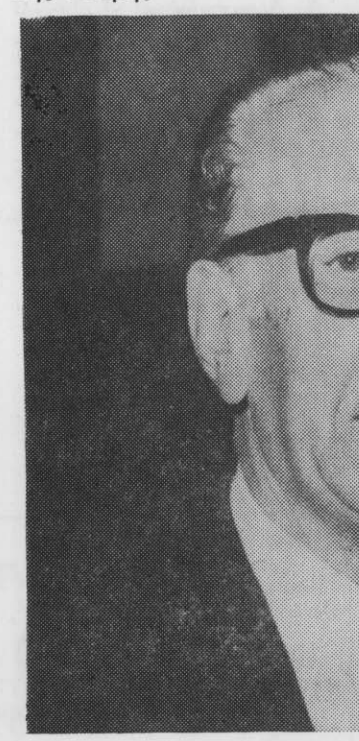
Παράλληλα, ἀσχολήθηκε καὶ μὲ τουριστικὰς ἐπιχειρήσεις στὴν ξηρὰ.

Ἀργότερα, ἀπογοητευμένος ἀπὸ τὴν ἀκτοπλοϊκὴ πολιτικὴ τοῦ Κράτους, πείστηκε νὰ ἀποτραβηχτεῖ ἀπὸ τὴν ἀκτοπλοῖα καὶ νὰ μείνει μόνον στὴς Ναυτικὰς Τουριστικὰς Γραμμῆς (Κρουαζιέρες), μὲ τὰ πλοῖα «ΦΡΙΩΝ», «ΑΤΛΑΝΤΙΣ», «ΓΑΛΑΞΙΑΣ», «ΚΕΝΤΑΥΡΟΣ» ἐν δράσει καὶ μὲ καθημερινὰς ἀναχωρήσεις στὰ ἑλληνικὰ νησιά μὲ τριήμερες, τετράήμερες καὶ ἑπταήμερες κρουαζιέρες, ὑψηλῆς στάθμης.