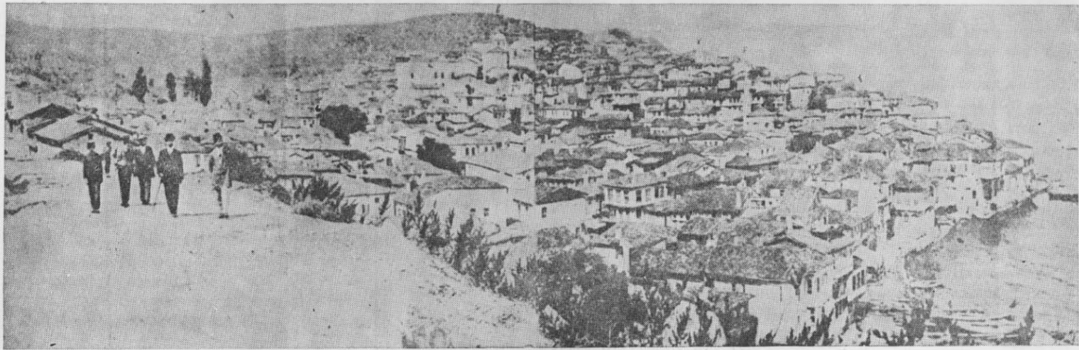
ΓΕΝΙΚΗ ΑΠΟΨΗ ΤΗΣ ΠΕΡΙΦΗΜΟΥ ΠΟΛΕΩΣ ΤΗΣ ΒΙΘΥΝΙΑΣ ΤΡΙΓΛΙΑΣ

Εμβάσματα - Δημοσιεύσεις εις κ. ΓΑΒΡ. ΜΗΤΣΟΥ Κομνηνών 21 - Θεσ/νίκη