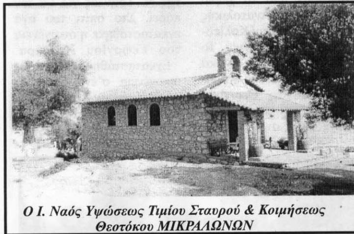
Ο Ι. Ναός Ύψωσης Τιμίου Σταυρού & Κοιμήσεως Θεοτόκου ΜΙΚΡΑΛΩΝΩΝ

Βοήθησε όχι μόνο οικονομικά κατά το μεγαλύτερο μέρος στην ανέγερση της Εκκλησίας που στοίχισε πολλά εκατομύρια, αλλά ήταν η ψυχή που ξεσήκωσε και τους υπόλοι-