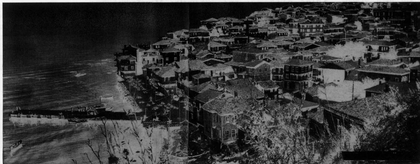
Γενική άποψη της περιφήμου πόλεως της Βιθυνίας Τρίγλιας

ΕΦΗΜΕΡΙΔΑ ΤΟΥ ΣΥΛΛΟΓΟΥ ΤΩΝ ΑΠΑΝΤΑΧΟΥ ΤΡΙΓΛΙΑΝΩΝ