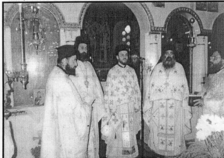
Οι Τριγλιανοί Ιερείς στην Λειτουργία των "ΧΡΥΣΟΣΤΟΜΙΩΝ '98"

σήμερα, ότι η Μικρασιατική Εκστρατεία ήταν το χρέος της Ελλάδας, που ο μεγάλος Κρητικός το ένωσε όπως καθαρά το υπηρέτησε προηγουμένως στον Θέρισο, απέναντι σε ένα παλλόμενο κομμάτι του Ελληνικού Έθνους, που προείχε η προστασία του και η διασφάλισή του.