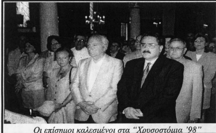
Οι επίσημοι καλεσμένοι στα "Χρυσοστόμια '98"