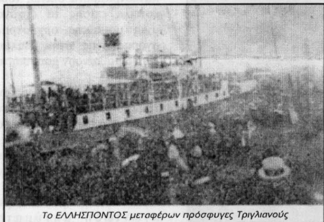
Το ΕΛΛΗΣΠΟΝΤΟΣ μεταφέρει πρόσφυγες Τριγλιανούς