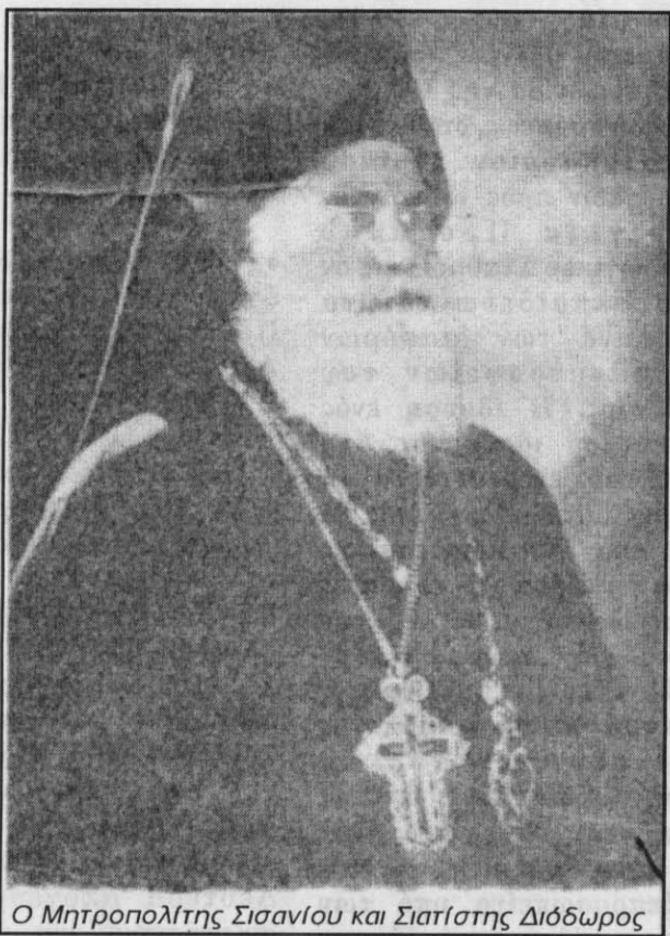
Ο Μητροπολίτης Σισανίου και Σιατίστης Διόδωρος

Το 1910 όταν, ο αείμνηστος Μητροπολίτης Δράμας Χρυσόστομος, εξορίζεται για δεύτερη φορά απ' την Δράμα στην αγαπημένη του Τρίγλια, ο Μητροπολίτης Σερρών Χριστόδουλος καλεί τον Διόδωρον στις Σέρρες ως διευθυντή του εκεί εθνικού ορφανοτροφείου και