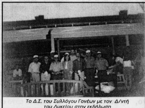
Το Δ.Σ. του Συλλόγου Γονέων με τον Δ/ντή του Λυκείου στην εκδήλωση

Οι νεαροί Σπαρτιάτες όταν ανδρών όταν υπόσχονται στους γερωντ