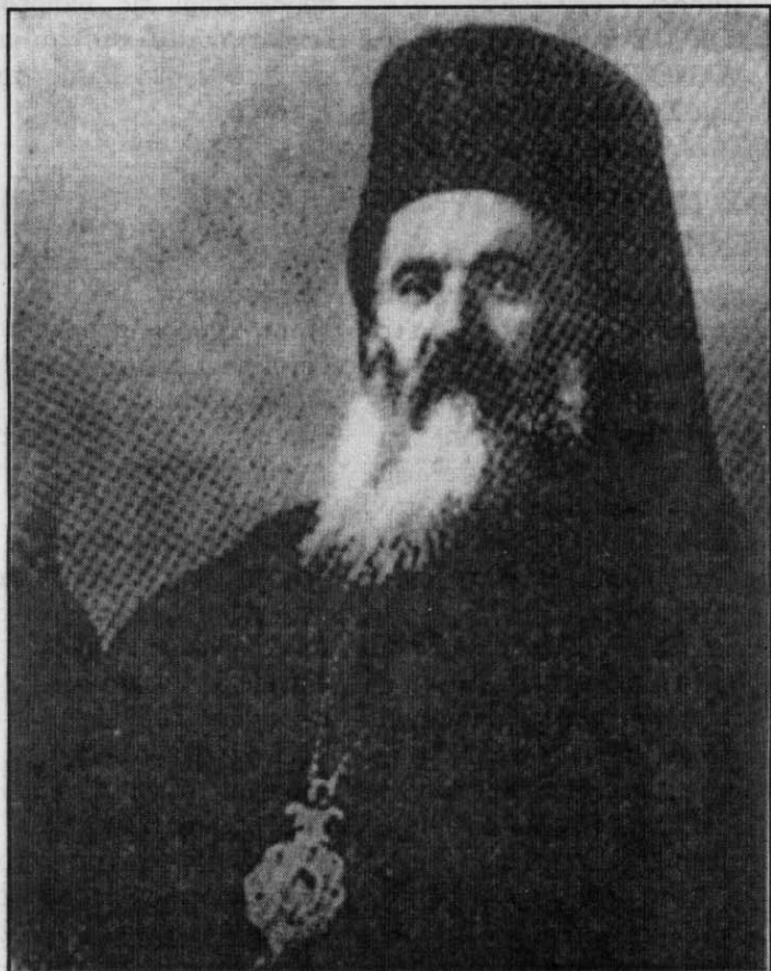
Ο Άγιος Ιερομάρτυρας Χρυσόστομος Σμύρνης

Οι εκδηλώσεις θα γίνουν με κάθε μεγαλοπρέπεια και αγάπη προς τιμήν του Αγίου και Ιερομάρτυρα Χρυσοστόμου Σμύρνης και όλων των νεκρών της Μικρασιατικής καταστροφής καθώς και προς τους κτήτορες και ευεργέτες της Ν. Τρίγλιας.