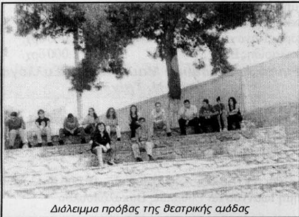
Διάλειμμα πρόβας της θεατρικής ομάδας

θούν το χώρο του ΔΗΠΕΘΕ Κοζάνης και να ζήσουν την εμπειρία της παρουσίασης μιας θεατρικής παράστασης στο κοινό. Η παιδαγωγική