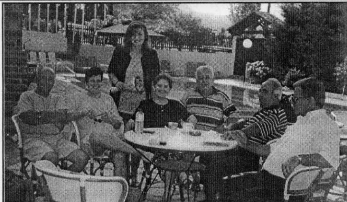
Τριγλιανοί από την εκδρομή στο Βόλο

Ο Σύλλογος θέλει να ευχαριστήσει θερμά την