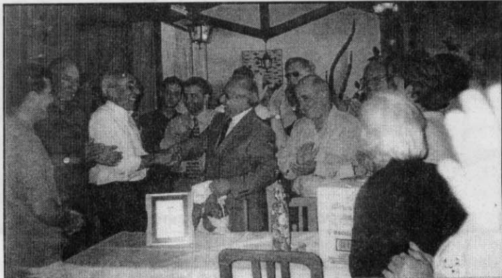
Θερμή χειραψία του Αντιπροέδρου μας με τον Δήμαρχο της Π. Τρίγλιας

Συνέλευσης του και διοργάνωσε εκδρομή προσκύνημα στην χαμένη και αλησμόνητη πατρίδα μας, την Τρίγλια της Μ. Ασίας.