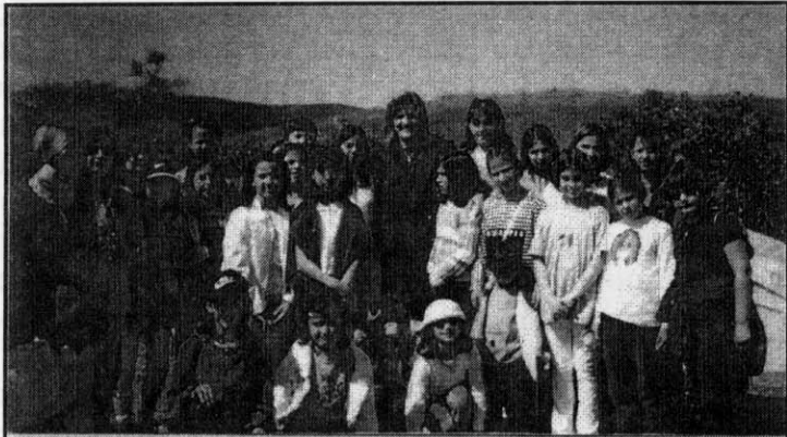
Τα παιδιά της χορωδίας με την πρόεδρο

Με την καταπληκτική παρέα των παιδιών μας και