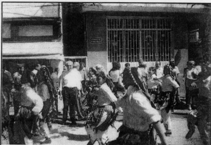
Την ώρα της υποδοχής στο Δημαρχείο της Π. Τρίγλιας

Ο μεγάλος δρόμος στην μέση του χωριού με τα