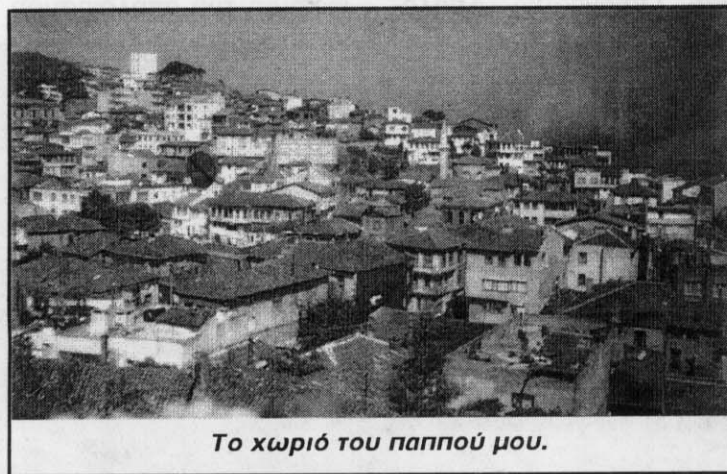
Το χωριό του παππού μου.

Όπως όλη η Τουρκία, πόλη ταξικών διαφορών. Φτώχεια και πλούτος απέναντι με ότι συνεπά- γεται ο αγώνας για να περάσεις από το πρώτο σκαλοπάτι στο δεύτερο. Κόσμος προβληματισμέ- νος. Χαμένος σε δρόμους που τον οδήγησαν μαζί με εκατομμύρια ανθρώπων της γης τα "ελεύθερα"