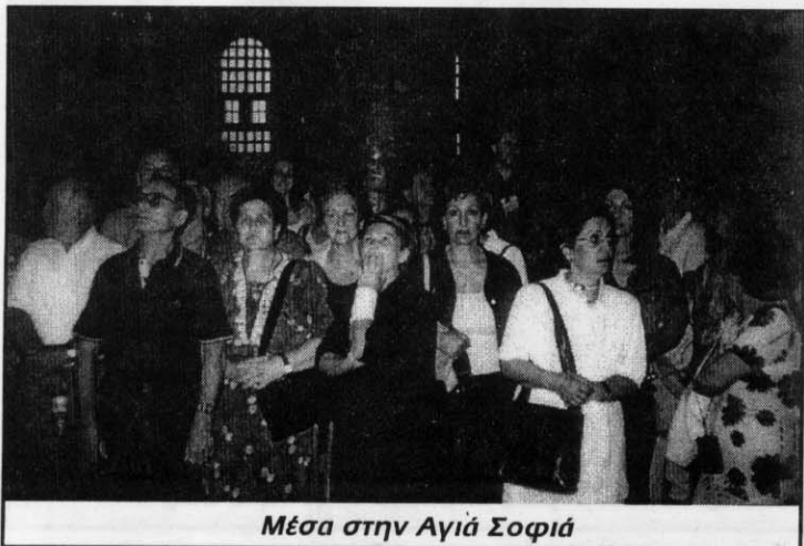
Μέσα στην Αγιά Σοφία