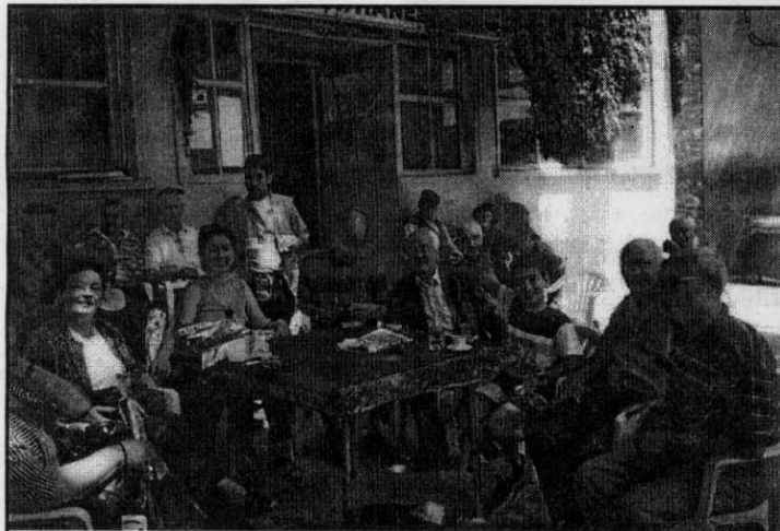
Στο καφενείο της Π. Τρίγλιας

Η διαδρομή από την Προύσα ως τα Μουδανιά αλλά πολύ περισσότερο από τα Μουδανιά ως την Τρίγλια άρχισε να με κερδίζει. Τόπος κατάφυτος, καταπράσινος, δίπλα στη θάλασσα, παρθένος. Ο δρόμος ελικοειδής ανηφόριζε και σιγά-σιγά κατηφόριζε προς την Τρίγλια Σε κάθε στροφή περίμενε πως θα φτάναμε. Είχα μεγάλη αγωνία! Ξαφνικά σε μια στροφή στο γήλωμα είδαμε δεξιά μας κάτω την Τρίγλια. Θαρρείς και βλέπαμε παλιά καρτ-ποστάλ. Ένα γραφικό