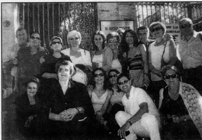
Στην Αγιά Σοφιά.

στρατιωτικές αρχές γλεντήσαμε μέχρι τις πρωινές ώρες, όπως ξέρουν να γλεντούν οι Τριγλιανοί.