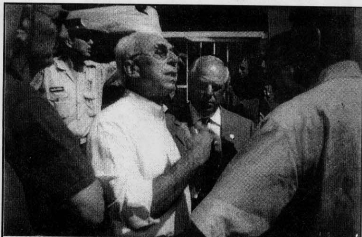
Στην πλατεία του χωριού με τον Δήμαρχο.

Μετά όλοι μαζί επισκεφθήκαμε την Παντοβασίλισσα. Μισογκρεμισμένοι τοίχοι, σοβαντισμένες οι αγιογραφίες, άθλια η κατάσταση. Και όμως για