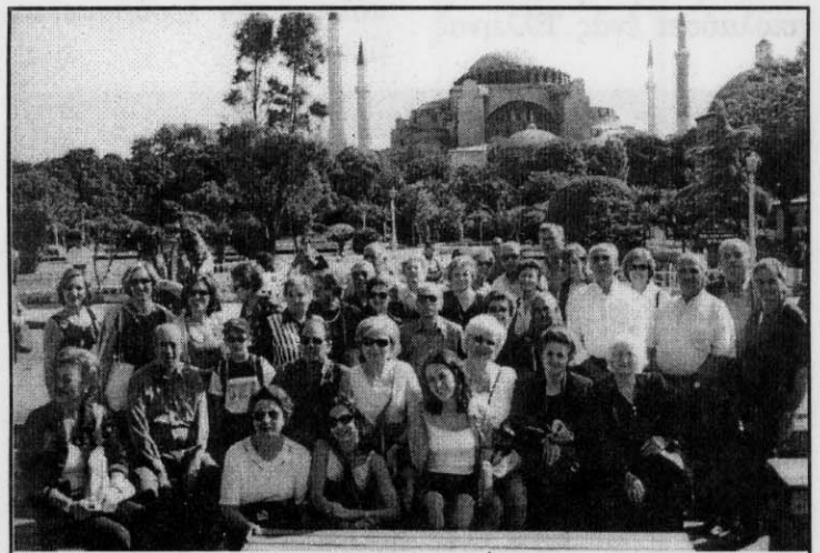
Οι εκδρομείς μπροστά στην Αγιά Σοφιά

της Χριστιανοσύνης, στον πολύπαθο Ναό στα χρόνια του Βυζαντίου, αλλά και