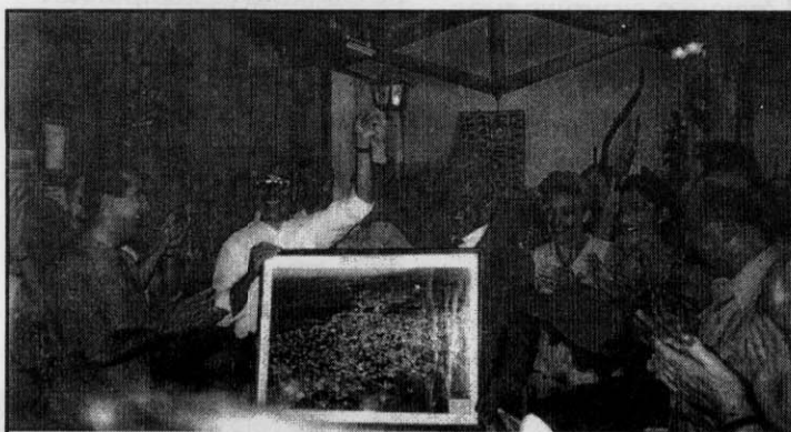
Ο αντιπρόεδρος του συλλόγου μας με τον Δήμαρχο της Π. Τρίγλιας

Φύγαμε με τις καλύτερες εντυπώσεις αλλά κυρίως