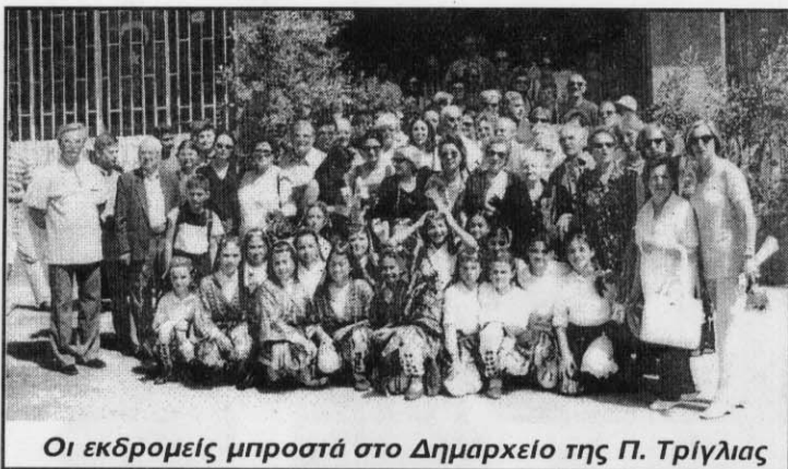
Οι εκδρομείς μπροστά στο Δημαρχείο της Π. Τρίγλιας

πατρίδα των γονιών μας και των προγόνων μας. Σπίτια παλιά πλάϊ στην