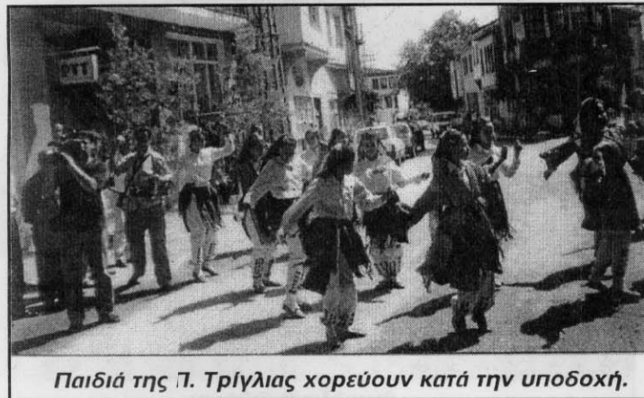
Παιδιά της Π. Τρίγλιας χορεύουν κατά την υποδοχή.

μέχρι την Κων/νούπολη χιλιάδες πολυκετοκίες και ατέλειωτες βίλες έχουν