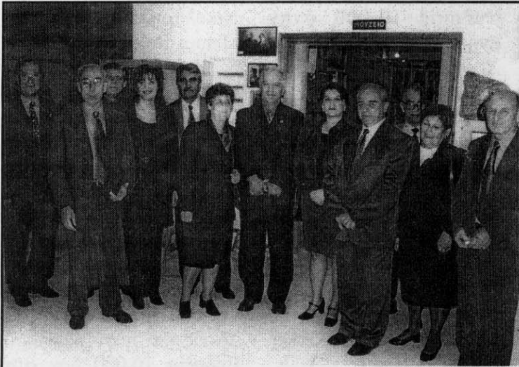
Οι Δήμαρχοι στο Μουσείο του Συλλόγου μας.

Της ευχόμαστε ολόψυχα να είναι καλά και να βρίσκεται κοντά μας και πάλι τον Σεπτέμβρη στα Χρυσοστόμια.