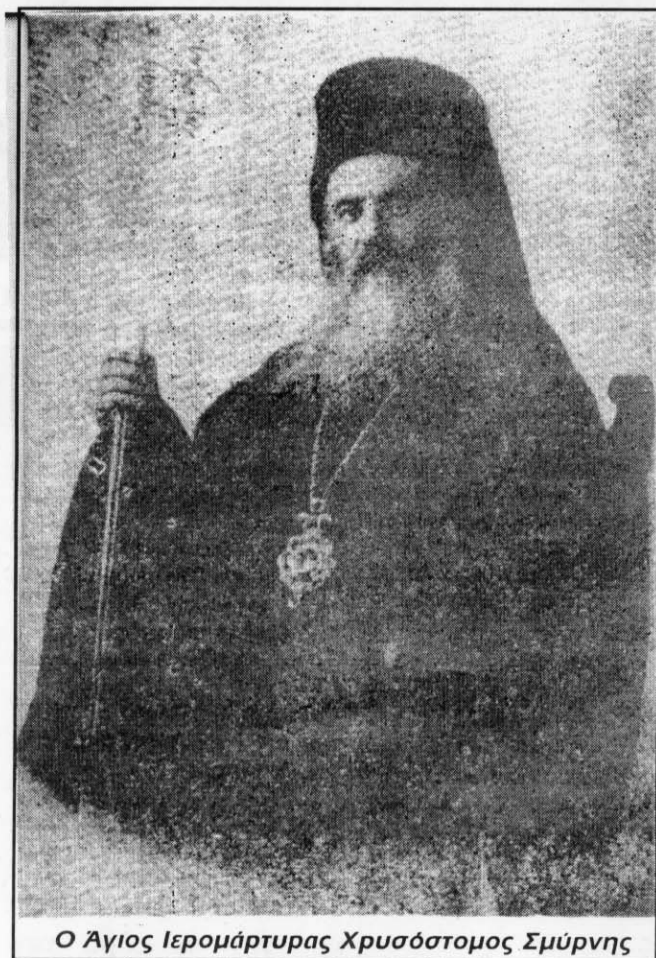
Ο Άγιος Ιερομάρτυρας Χρυσόστομος Σμύρνης

Αξίζει να σημειωθεί ότι ο ίδιος ο Καβουνίδης με μερικούς χωριανούς και άνδρες από τα πληρώματα των πλοίων κατάφεραν να σώσουν ότι πολυτιμότερο υπήρχε στις εκκλησίες του χωριού. Ήταν γαμπρός επ' αδελφή του Χρυσοστόμου Σμύρνης.