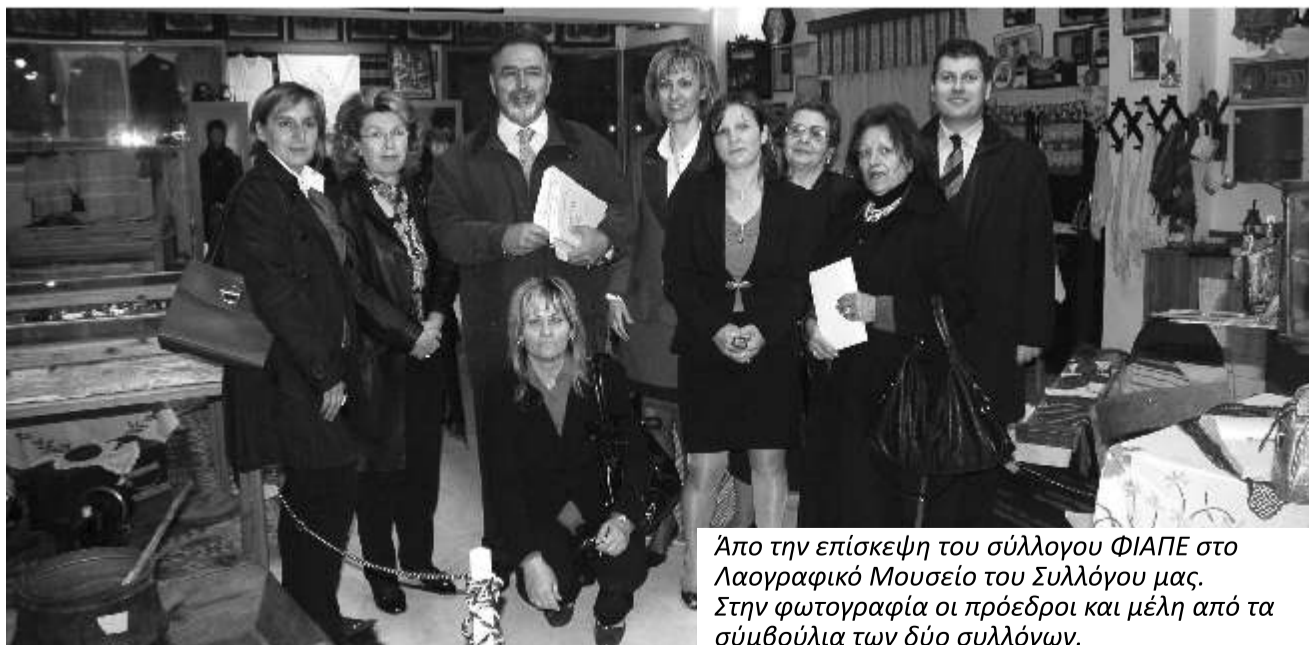
Απο την επίσκεψη του σύλλογου ΦΙΑΠΕ στο Λαογραφικό Μουσείο του Συλλόγου μας. Στην φωτογραφία οι πρόεδροι και μέλη από τα συμβούλια των δύο συλλόγων.