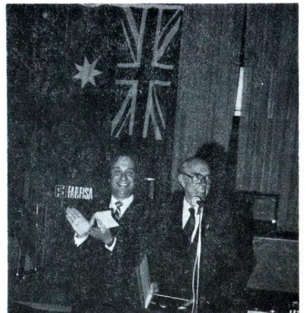
Ο εν Αθήναις Αυστραλός πρεσβευτής κ. Τζόνστον μετά τού κ. Συμπριού Τσιτσιφύλλη

Ο έλληνισμός της Αυστραλίας κατά 70% είναι εκ Μακεδονίας. Γι' αυτό παριστάται έπιτακτική ανάγκη να δημιουργηθεί άδεχομήτως άυστραλιανό προξένιο στη Θεσσαλονίκη ή τουλάχιστον να τοποθετηθεί έδω έπιτετραμένως πρόξενος να έπανασταυθεί πάλι έδω τó