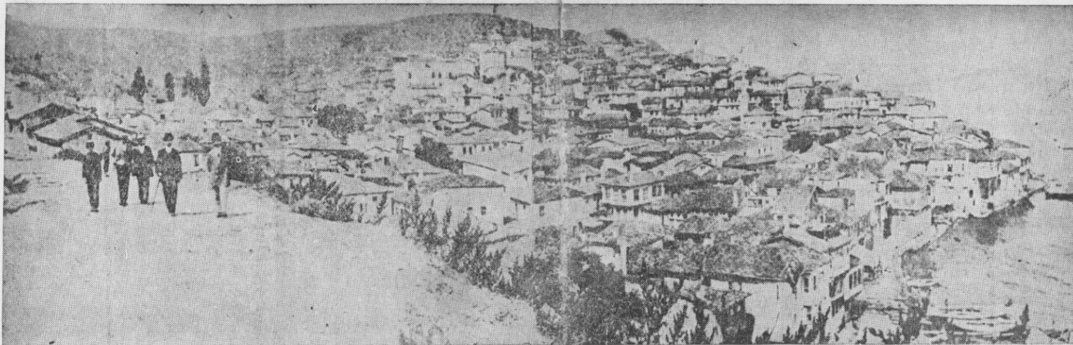
ΓΕΝΙΚΗ ΑΠΟΨΗ ΤΗΣ ΠΕΡΙΟΧΗΣ ΠΟΛΕΩΣ ΤΗΣ ΒΙΘΥΝΙΑΣ ΤΡΙΓΛΙΑΣ

Εμβόσματα και δημοσιεύσεις εις κ. ΓΑΒΡ. ΜΗΤΣΟΥ Κομνηνών 21, Θεσ/νίκη