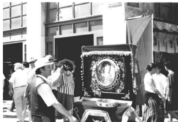
Στο κέντρο της Αθήνας γλυκολαλούν συχνά λατέρνες, από το Μοναστηράκι, στην Αθηνά, στην Αιόλου, στην Ερμού, στην Ανδριανού, στην Πλάκα, στο Θησείο.