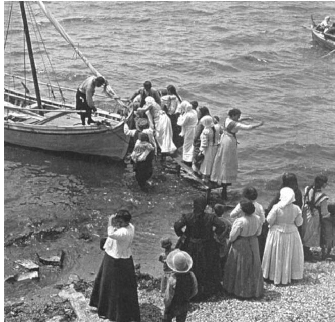
Οι Έλληνες κάτοικοι της Φώκαιας και των γύρω περιοχών επιβιβάζονται σε πλοία για να αναχωρούν για την Θεσσαλονίκη, τον Πειραιά ή την Μυτιλήνη, Σάββατο 13 Ιουνίου 1914.

Οι φωτογραφίες του ανακαλύφθηκαν από τον κ. Χάρη Γιακουμή τον Μάιο του 2005, όταν ένας Γάλλος έμπορος που τις είχε αποκτήσει σε έναν πλειστηριασμό στη Γαλλία, τον κάλεσε να τις δει. Ο έμπειρος ιστορικός φωτογραφίας δεν άργησε να ανακαλύψει ότι είχε μπροστά του το φωτογραφικό αρχείο του Γάλλου αρχαιολόγου Felix Sartiaux. Ανάμεσα στα άλλα εντόπισε και ένα βιβλιράκι γραμμένο από τον Γάλλο αρχαιολόγο με τίτλο “Le sac de Phocée et l’expulsion des Grecs ottomans d’Asie Mineure” (Η καταστροφή της Φώκαιας και η εκδίωξη των Ελλήνων οθωμανών από την Μικρά Ασία) που διαβάζοντας το διαπίστωσε με έκπληξη –όπως αναφέρει ο ίδιος ο Χάρης Γιακουμής στον πρόλογο του βιβλίου με τις φωτογραφίες– ότι ορισμένες από τις φωτογραφίες, φώτιζαν το κείμενο που εξιστορούσε ο Sartiaux λεπτό προς λεπτό το τι πέρασαν οι Έλληνες Φωκειανοί κατά το «μαύρο ημερονύκτιο», όπως το είχε χαρακτηρίσει ένας αυτόπτης μάρτυ-