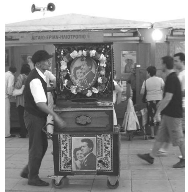
Λατερνατζής με την λατέρνα του στην παραλία Θεσσαλονίκης